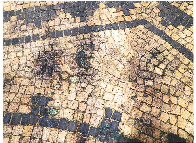
Traitement chimique effectué sur une bande de la mosaïque de Bacchus et Ariane pour évaluer l'ampleur de la colonisation fongique et sa résistance.

Des réflexions sont actuellement menées pour trouver un équilibre entre l'abaissement du taux d'humidité relative de l'air par la ventilation et l'assèchement de surface du pavement, et la qualité de sa préservation et de sa présentation. En effet, et c'est inévitable, l'assèchement diminuerait sensiblement le contraste coloré des pierres humides et serait susceptible d'engendrer des phénomènes de cristallisation à la surface ou au-dessous des tesselles (efflorescences, soulèvements, cloques). Des tests documentés vont être lancés prochainement pour nourrir ces discussions.