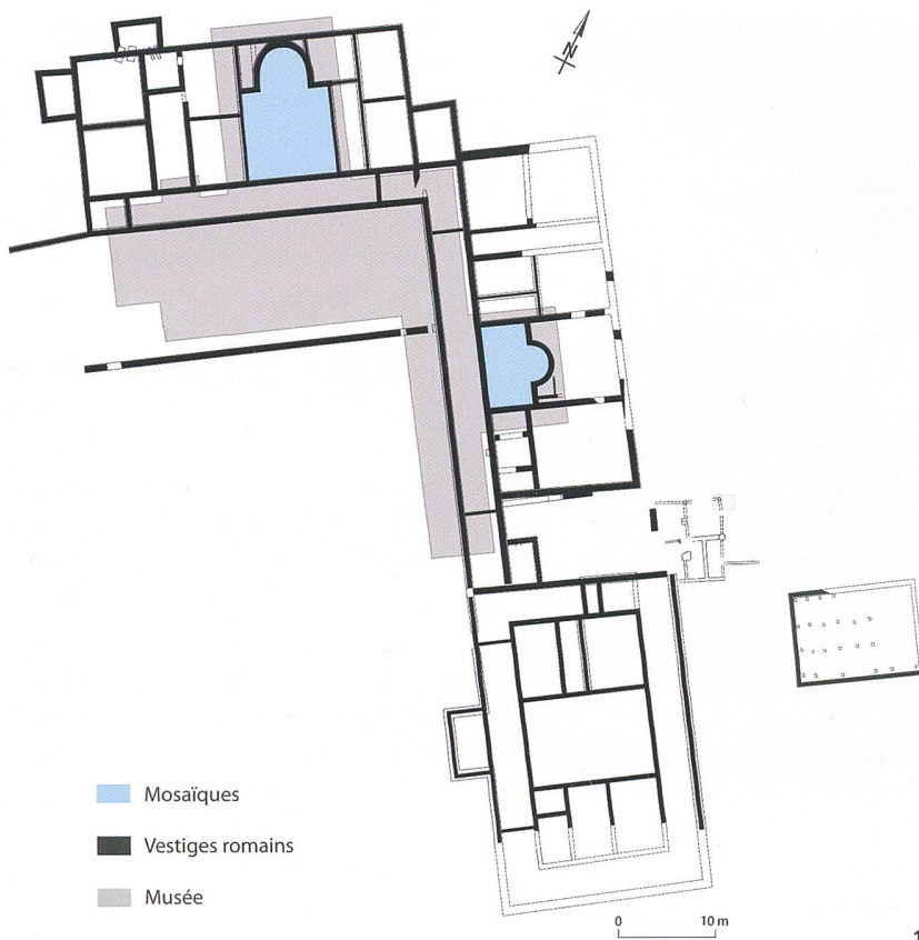
Fig. 10 Plan schématique du musée et des vestiges antiques.

Schematischer Plan des Museums und der antiken Baureste.