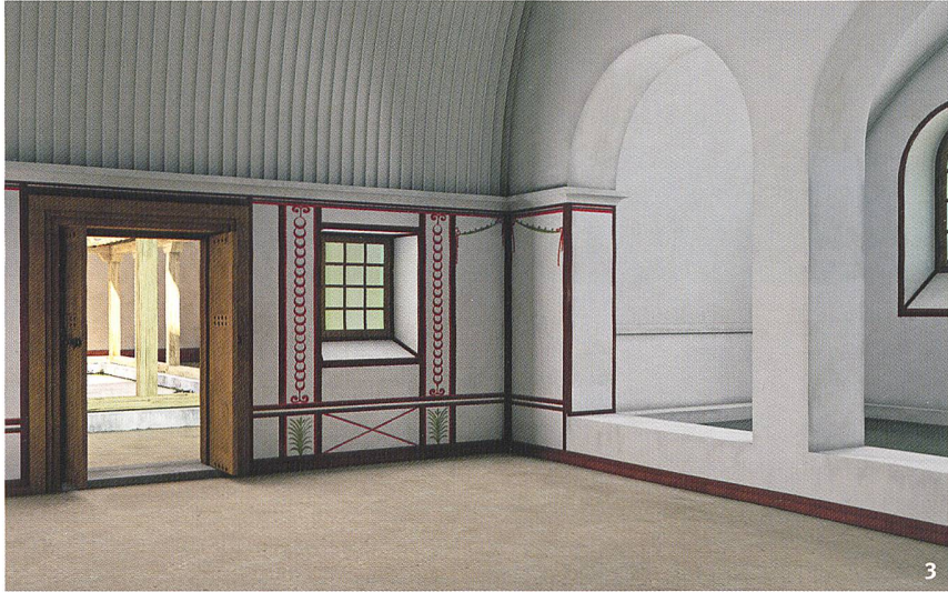
Abb. 3 und 4 Rekonstruktionsvorschlag der römischen Thermenanlage im Bauzustand der zweiten bis dritten Phase (spätes 1./frühes 2. Jh.). Abb. 3: Blick ins Kaltbad mit dem Kaltwasserbecken (rechts) und einer Tür zum Innenhof (links). Abb. 4: Blick ins Heissbad mit Apsis und kunstvoll verziertem Bleibecken.

Propositions de restitution des installations thermales durant les deuxième et troisième phases de construction (fin 1 er -2 e siècle). Fig. 3: vue de la salle froide avec la piscine (à droite) et une porte vers la cour intérieure (à gauche). Fig. 4: vue de la salle chaude dotée d'une abside et d'un bassin en plomb richement décoré.