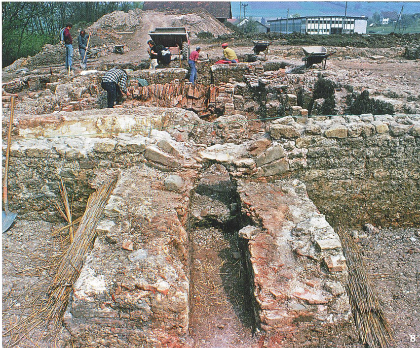
Abb. 8 Die römischen Thermen bei Schleithem. Ausgrabungsfoto von 1975.

Les thermes romains près de Schleithem. Vue des fouilles de 1975.