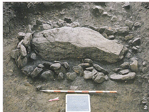
Fig. 2 Bellinzona-Carasso. La copertura della tomba 20 rinvenuta nel 2018.