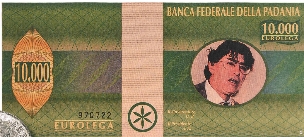
Abb. 1 Imaginäre Banknote der «Banca Federale della Padania» zu 10000 Eurolega. Billet de banque imaginaire de la «Banca Federale della Padania» de 10000 eurolega. La banconota immaginaria da 10000 eurolega della «Banca Federale della Padania».