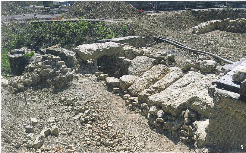
Fig. 5 Vue des maçonneries dégagées au pied de la façade. Au premier plan, les vestiges extérieurs de la galerie ayant remplacé l'exutoire primitif. En arrière-plan, les murs de la digue primitive.

Veduta dell'opera muraria portata alla luce ai piedi della facciata. In primo piano, le vestigia esterne della galleria che ha rimpiazzato il canale. Sullo sfondo le mura della diga originaria.