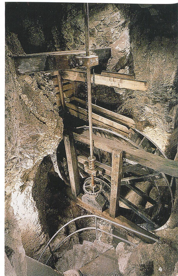
Fig. 4 Roue à augets installée à l'intérieur de la grotte, dans le puits n°2, depuis 1984.

Son sol était constitué à l'ouest d'un grossier pavage et, à l'est, de terre battue recouverte d'une épaisse couche de sciure. Au centre ont été dégagées deux fosses maçonnées rectangulaires de 2 m par 0,7 m de côté, profondes de 0,7 m et reliées entre elles par un solide massif maçonné (fig. 2, n° 12). Les surfaces apprêtées des blocs d'encadrement et les restes de fixations métalliques attestent que ces aménagements