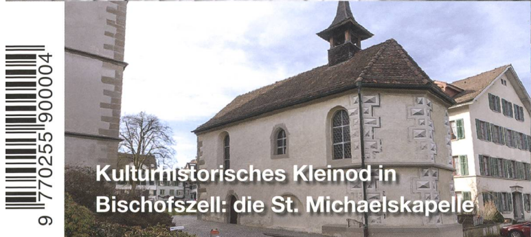
Kulturhistorisches Kleinod in Bischofszell: die St. Michaelskapelle