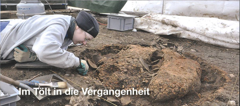
Im Tölt in die Vergangenheit