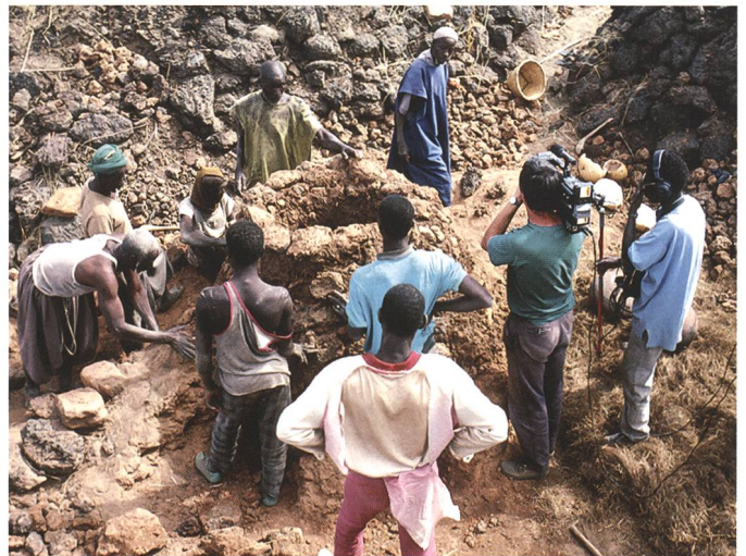
Tournage au Mali du film Inagina l'ultime maison du fer .

E. H.: La réalisation d'un film est un véritable défi: il faut un réalisateur et un archéologue. C'est un travail à deux: le réalisateur ne connaît rien au discours et l'archéologue a besoin de lui pour la technique et donner un rythme au film. Le dialogue entre les deux disciplines est essentiel. Il ne faut pas que le réalisateur interrompe les archéologues au travail, il doit se fondre dans l'équipe et en faire partie. De même, le discours ne doit pas être coupé sans l'accord du scientifique. Seule une bonne collaboration entre les deux peut donner un bon documentaire. Propos recueillis par Christophe Goumand