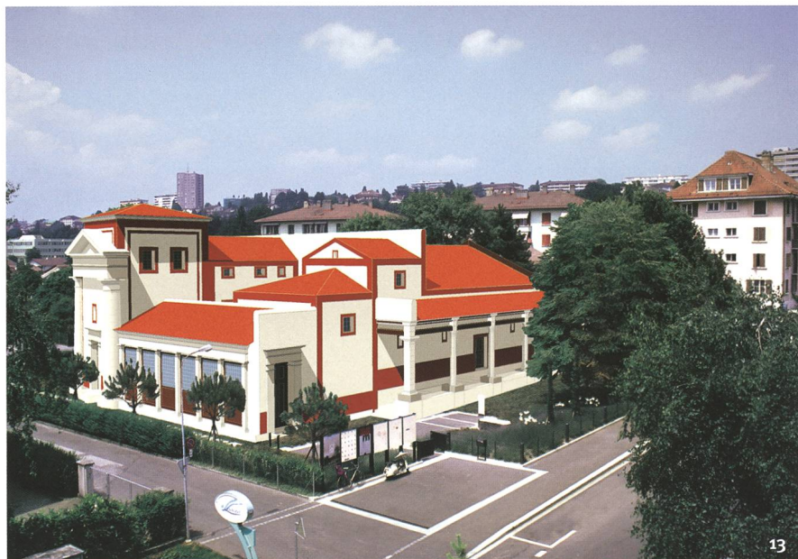
Fig. 13 La reconstitution de la domus de Vidy incrustée dans l'urbanisme actuel dans le film Lausanne à l'époque romaine en 1995.

Die Rekonstruktion des domus von Vidy, eingebettet ins heutige Stadtbild, im Film Lausanne à l'époque romaine von 1995.