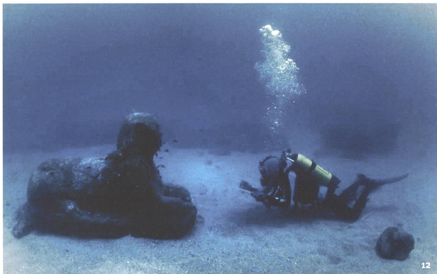
Fig. 12 Image extraite du film Le phare d'Alexandrie, la septième merveille du monde 1996.

Standbild aus dem Film Le phare d'Alexandrie, la septième merveille du monde von 1996.