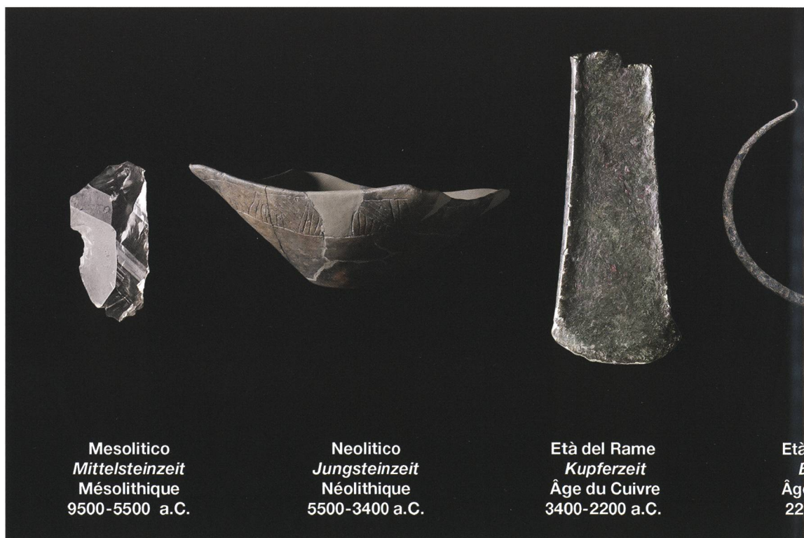
Mesolitico Mittelsteinzeit Mésolithique 9500-5500 a.C.