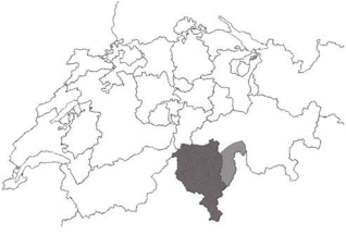
Fig. 1 Località di ritrovamenti archeologici nel Cantone Ticino e nella Regione Moesa (Cantone dei Grigioni) menzionate negli articoli.

Archäologische Fundstellen im Kanton Tessin und in der Region Moesa (Kanton Graubünden), die in den Artikeln erwähnt werden.