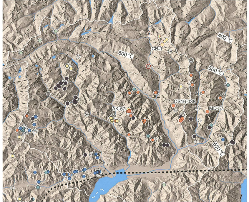
Fig. 7 Distribuzione dei giacimenti e laboratori di pietra ollare in Ticino e nel Moesano.