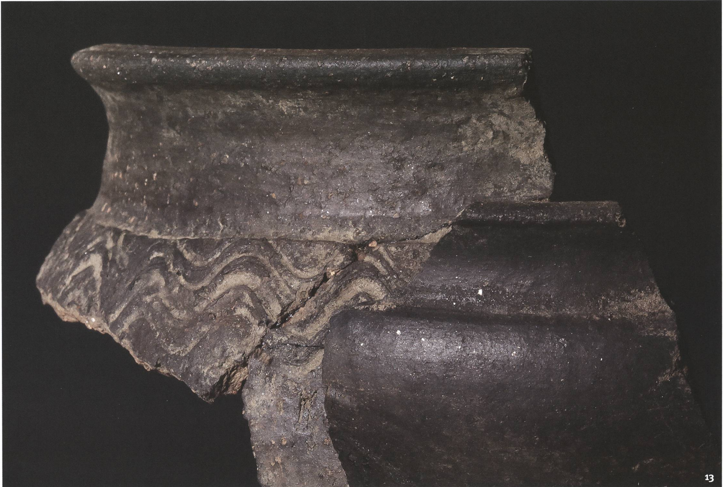
Fig. 13 Coppetta di ceramica lucidata e, in secondo piano, olla decorata a onde impresse al pettine.

Schale aus polierter Keramik, im Hintergrund einen Topf mit Kammdekor in Wellenform.