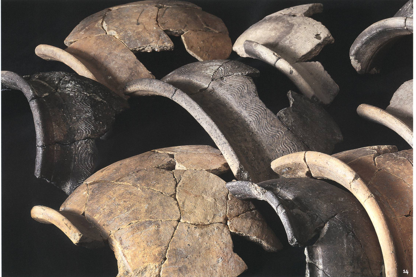
Fig. 14 Esemplari di olle da cottura di varie tipologie, da contesti di I secolo.

Beispiele für Kochgefäße verschie- dener Typen, aus Fundkontexten des 1. Jh.