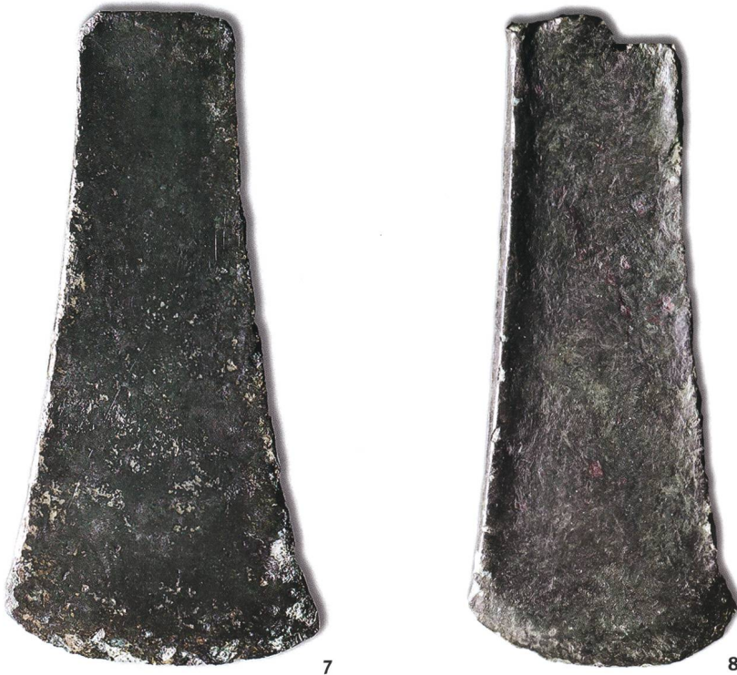
Fig. 7 La lama di ascia piatta in rame puro da Castel Grande; è difficile proporre una datazione in assenza di elementi di paragone a livello regionale.

Flache Beilklinge aus reinem Kupfer von Castel Grande. Eine Datierung ist aufgrund fehlender regionaler Vergleichsstücke schwierig.