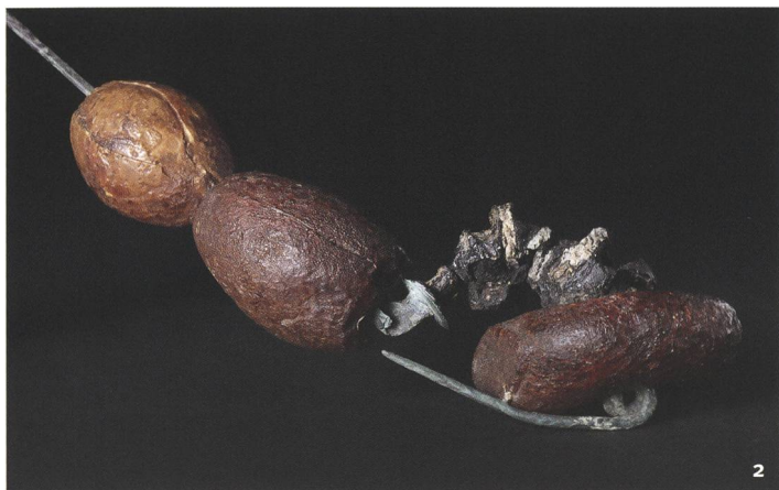
Fig. 2 Fibula di bronzo da Pazzallo; sull'arco e sull'ardiglione sono inse- riti vaghi d'ambra, 450-380 a.C.

Bronzefibel aus Pazzallo mit Bernsteinperlen auf dem Bügel und an der Nadel, 450-380 v.Chr.