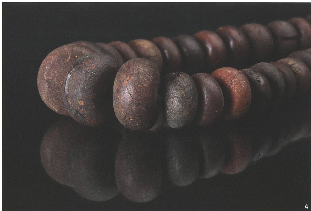
Fig. 4 Collana formata da vaghi d'ambra da Locarno-Solduno, 380-250 a.C.

Während der Eisenzeit vergrößerte sich das Typenspektrum in beachtlicher Weise: Neben Perlen und Anhängern finden nun auch Nadelköpfe, überzogene Bogenfibeln, Siegel, Spinnrocken und Spindeln Verbreitung. Bernstein kommt ebenfalls bei der Verzierung von Schwertern, Stoffen, Pektoralen, Diademen und Möbeln zum Einsatz. Seit dem 8. Jh. v.Chr. sind in Etrurien und Latium die ersten geschnitzten Tier- und Menschenfiguren belegt: Sie bestätigen die Existenz von spezialisierten Produktionszentren mit Handwerkern, die in der Lage waren, das Rohmaterial zu bearbeiten. In den keltischen oder keltisierten Gebieten sind Bernsteinfunde keineswegs gleichmäßig verteilt. Neben Gegenden wie Mähren, in denen Bernstein nur sporadisch nachgewiesen ist, sind andere mit einer hohen Fundkonzentration bekannt. Dies ist im Kanton Tessin und im Misox der Fall – laut antiker Quellen siedelten hier