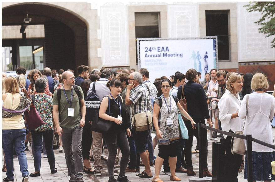
Fig. 3 Barcelona 2018: For the first time more than 3000 participants took part in an EAA Annual Meeting.

Barcelone 2018: pour la première fois, plus de 3000 participants ont pris part à une rencontre annuelle de l'EAA.