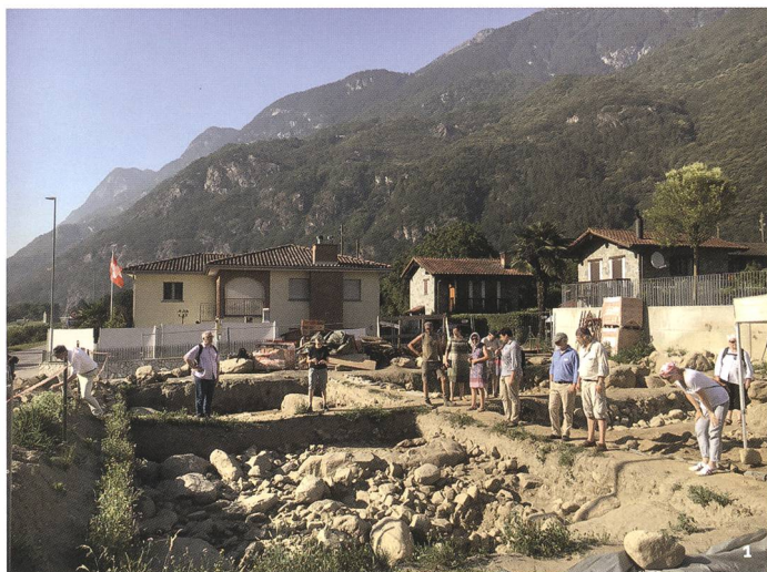
Fig. 1 La visita al sito megalitico durante l'Assemblea generale di AS – giugno 2019.

A seguito di consuete verifiche archeologiche su un mappale di Bellinzona-Claro – inserito a piano regolatore come Perimetro di interesse archeologico (PIA – Duno) – sono state portate alla luce le strutture appartenenti a un luogo di culto preistorico sviluppatosi su più fasi cronologiche. La fase più antica è da ascrivere al periodo finale del Neolitico, datata da analisi C14 e da frammenti ceramici al 2500-2300 a.C. In questo periodo è stato eretto un complesso megalitico formato da almeno cinque grandi massi in gneiss (3-3,5 m x 1,5 m; peso di circa 3-4 tonnellate) e altrettanti di grandezza inferiore; probabilmente i massi provengono in parte dal cono di deiezione di Claro, altri per contro sono stati estratti da cave nei dintorni. Nella maggior parte delle pietre sono state rilevate sicure tracce della lavorazione per l'estrazione e della sbozzatura. I megaliti sono stati collocati nel terreno secondo una precisa finalità religiosa o sepolcrale che corrisponde alle caratteristiche di un sito megalitico neolitico, che è stato verosimilmente abbandonato verso la fine del terzo millennio a.C.