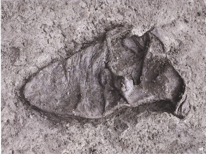
Fig. 10 Chaussure en cuir presque complète découverte au fond du fossé-dépotoir ST 42 (dernier quart du 13 e – première moitié du 14 e siècle; long. env. 27 cm).

Fast vollständiger Lederschuh, der an der Sohle des Abfallgrabens ST 42 entdeckt wurde (letztes Viertel 13. bis erste Hälfte 14. Jh.; Länge ca. 27 cm).