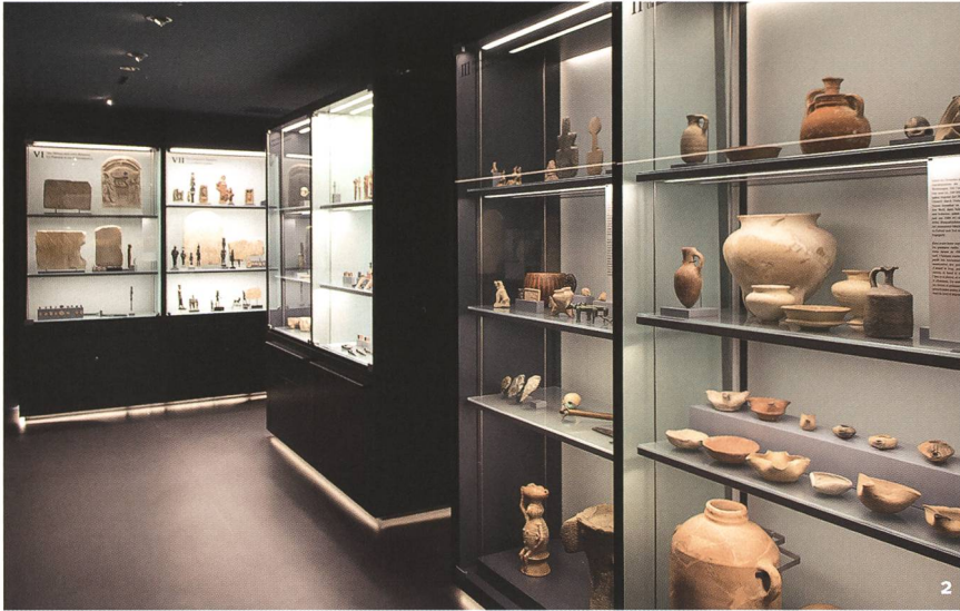
Fig. 2 L'exposition de référence actuelle du Musée Bible+Orient.

Die aktuelle Dauerausstellung des Museums Bible+Orient.