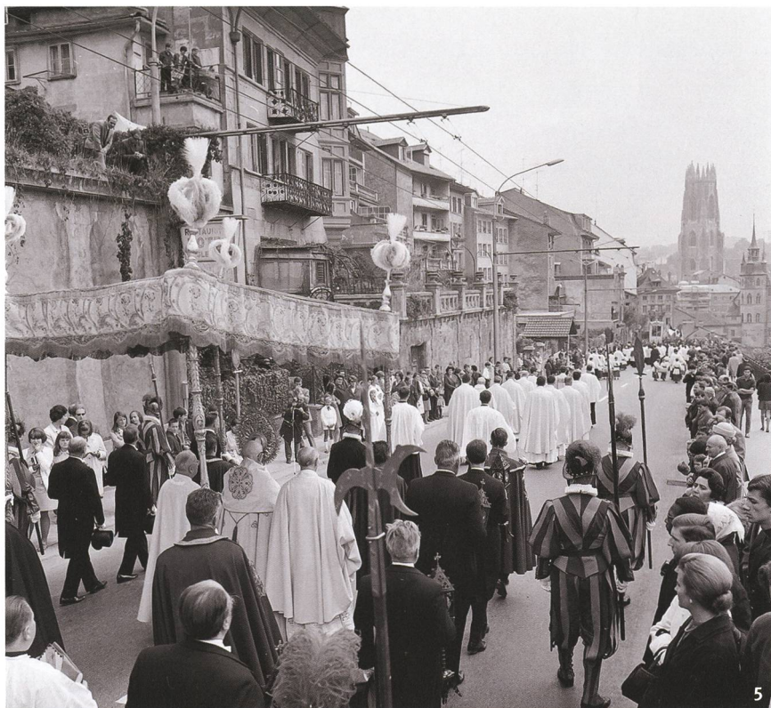
Fig. 5 Fribourg, procession de la Fête-Dieu. Fribourg, Frohnleichnamsprozession. Friburgo, processione del Corpus Domini.