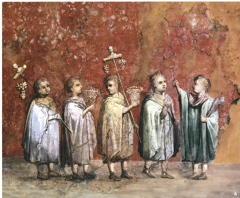
Fig. 4 Procession en l'honneur de Bacchus, probablement pour célébrer les vendanges. Fresque d'Ostie, 209-211 apr. J.-C.

Prozession zu Ehren von Bacchus, wahrscheinlich zur Feier der Ernte. Fresko aus Ostia, 209-211 n.Chr.