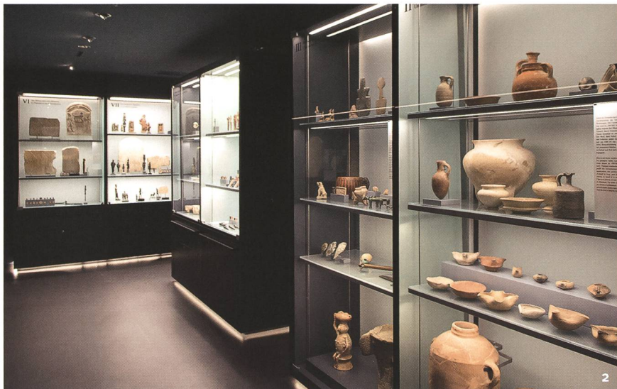
Fig. 2 L'exposition de référence actuelle du Musée Bible+Orient.

Die aktuelle Dauerausstellung des Museums Bible+Orient.