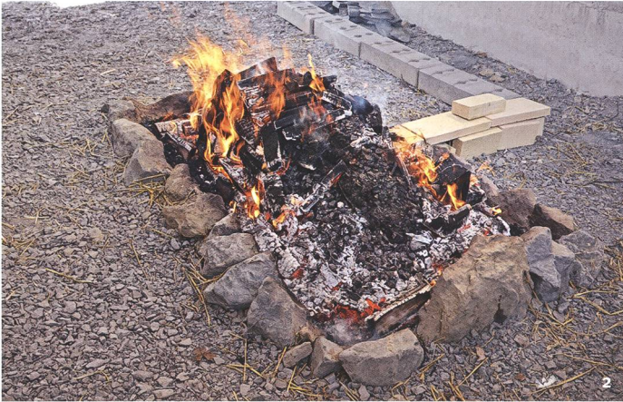
Abb. 2 Der Röststapel nach ostalpinem Vorbild mit der Verkleidung für das Thermoelement auf der Rückseite.