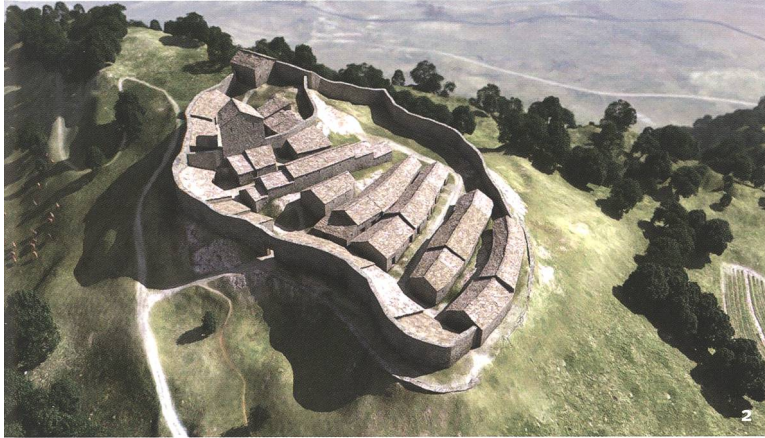
Fig. 2 Ricostruzione 3D del villaggio nel XIII secolo.