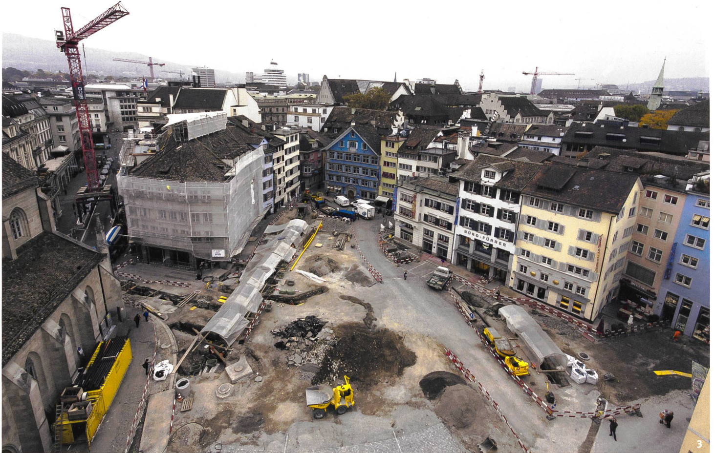
Abb. 3 Blick auf die Grabungen auf dem Münsterhof 2015 in Richtung Westen mit der Fraumünsterkirche links im Bild.

Veduta degli scavi del Münsterhof del 2015 in direzione ovest con la chiesa di Fraumünster a sinistra dell'immagine.