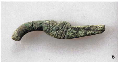
Abb. 5 Fragmente von Trensenknebeln aus Geweih, 1. Jh. v.Chr.

Frammenti di elementi di morso equino in palco di cervide, I sec. a.C.