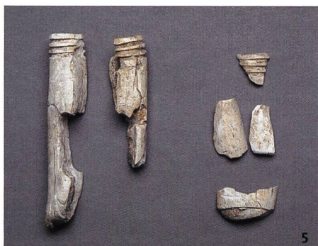
Fig. 5 Fragments de mors en bois de cer- vidé, 1 er siècle av. J.-C.

Frammenti di elementi di morso equino in palco di cervide, I sec. a.C.