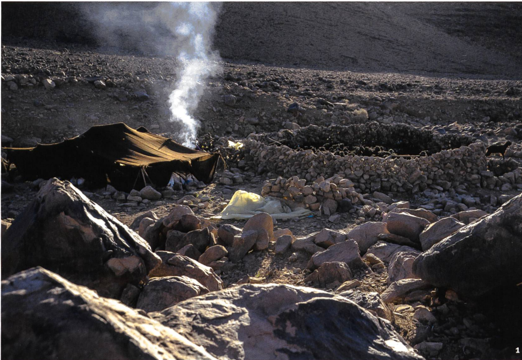
Abb. 1 Das Winterlager mit Zelt und Viehpferch im Jbel Sagrho, Südmorokko, 2018.

Le campement d'hiver: tente et enclos pour le bétail dans le Jbel Sagrho, sud du Maroc, 2018.