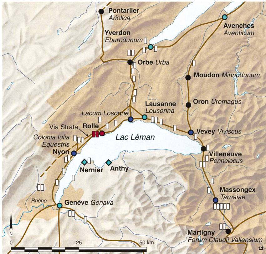
Fig. 11 Voies, milliaires, ports et pontons romains de Suisse occidentale et du pourtour lémanique.

Römische Strassen, Meilensteine, Häfen und Anlegestellen in der Westschweiz und rund um den Genfersee.