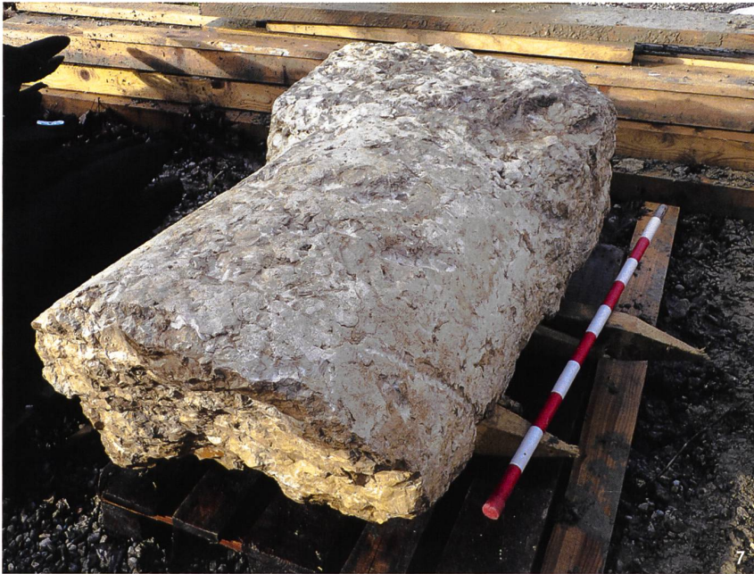
Fig. 7 Le milliaire A lors de son prélèvement. Base: larg. 80 cm, prof. conservée 50 cm; haut. 60 cm. Cylindre: diam. 68 cm, haut. 79 cm. Poids total 842,5 kg; haut. totale conservée 139 cm.

Meilenstein A in Fundlage. Basis: Breite 80 cm, erhaltene Tiefe 50 cm; Höhe 60 cm. Zylinder: Dm. 68 cm, Höhe 79 cm. Gesamtgewicht 842.5 kg; erhaltene Gesamthöhe 139 cm.