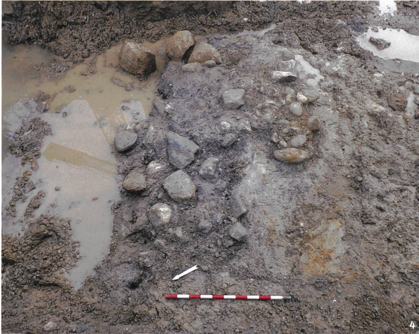
Fig. 4 Vestiges de l'empierrement du ponton.