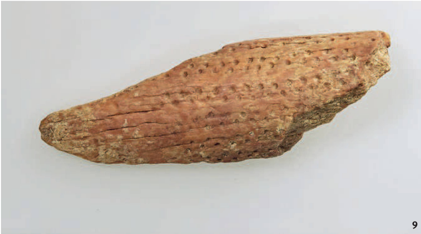
Abb. 9 Mit regelmässigen Grübchenreihen verziertes Hirschgeweihfragment, das gemäss ^{14}\text{C} -Datierung gut 12 000 Jahre alt ist.

Fragment de bois de cerf décoré d'incisions régulières en forme de petits creux (cupules). Selon la datation ^{14}\text{C} , il est vieux de 12 000 ans.