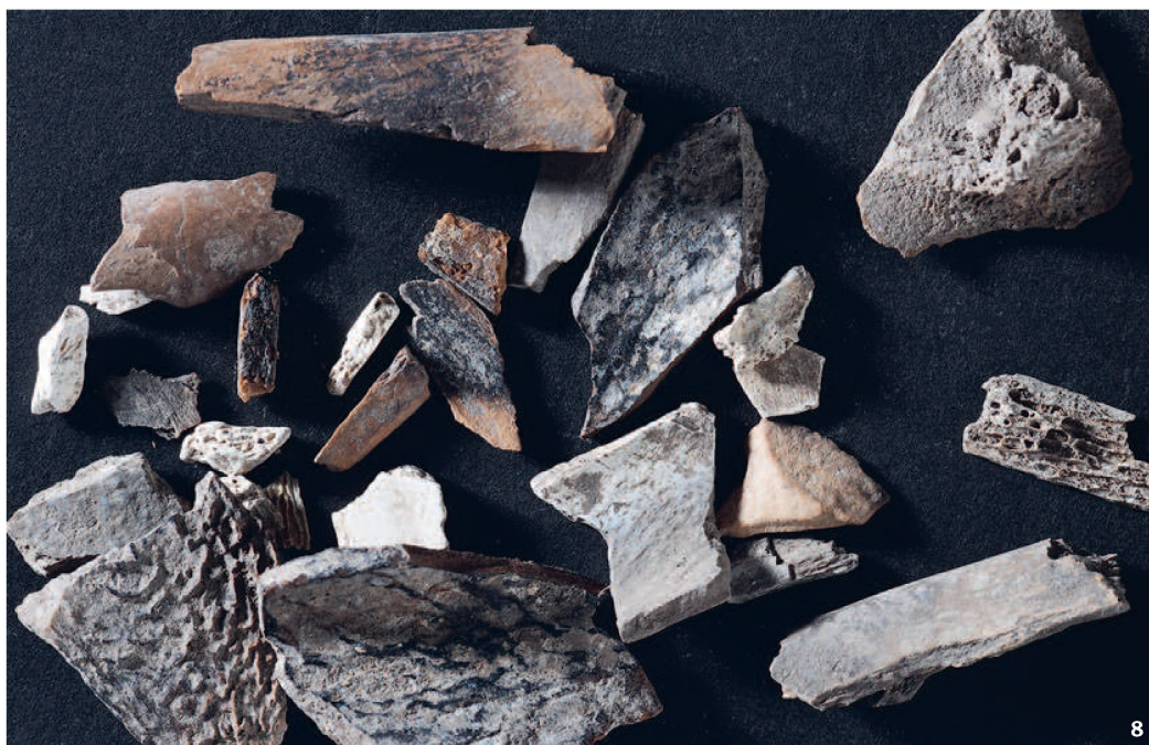
Abb. 8 Hitzeversehrte Knochenfragmente aus der mittelsteinzeitlichen Kulturschicht.

Nach Abschluss sämtlicher Grabungsarbeiten war geplant, am Vormittag des 12. Augusts 2020 den Schnitt wieder zuzuschütten. Während des kurzen, steilen Aufstiegs zum Flözerbändli entschloss man sich jedoch kurzfristig, noch eine Bodenprobe im Bereich der mittelsteinzeitlichen Schicht zu nehmen. Deshalb wurde in der engen Grabung das Nordprofil mit einer Bürste gereinigt und anschliessend in 1.47 m Tiefe ein Plastiksack mit Sediment gefüllt. Dabei wurde ein grösserer Faunenrest freigelegt. Die Begeisterung war mässig, hatte das Team doch bereits alle Knochen verpackt und frankiert, um sie ans Laboratoire