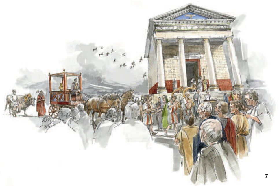
Abb. 7 Rekonstruktion des Jupitertempels von Salodurum .