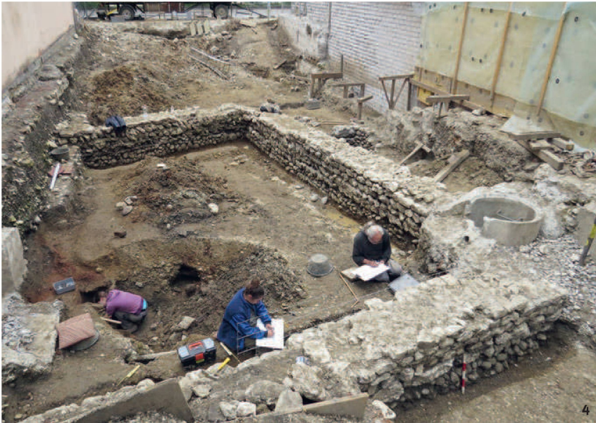
Abb. 4 Olten-Baslerstrasse 15. Überreste eines Steingebäudes aus dem 2. Jh. bei der Ausgrabung 2016.

Resti di un edificio in pietra del II sec. a Olten-Baslerstrasse 15 durante lo scavo del 2016.