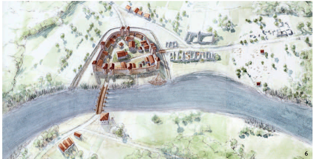
Abb. 6 Das castrum von Solothurn um das Jahr 400. Il castrum di Soletta verso il 400.

auf der spätrömischen Castrumsmauer auf. An der Marktgasse im Süden, gegen die Dünern hin, reichte die spätantike Befestigung sogar ein wenig über die heutige Altstadt hinaus. Ungeklärt ist der Verlauf der Befestigung im Osten, an der Zielempgasse, gegen die Aare hin.