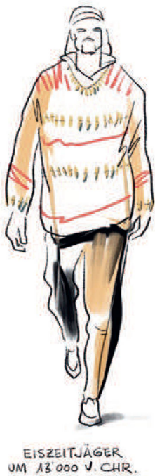
Fig. 8 Chasseur magdalénien. Fragiles aiguilles en os trouvées dans la grotte de Rislisberg. Long. 2,3- 4,2 cm, diam. 2 mm.

Cacciatore dell'era glaciale del Maddaleniano. Fini aghi in osso dalla caverna di Rislisberg. Lung. 2,3- 4,2 cm, larg. 2 mm.