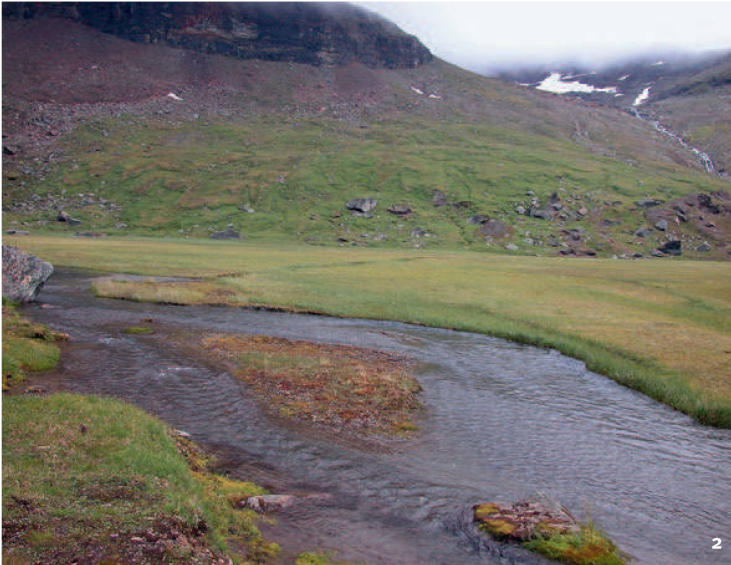
Fig. 2 Conditions de vie semblables à celles de la fin de la dernière glaciation: paysage de toundra dans la partie suédoise de la Laponie.

Il paesaggio moderno della Lapponia svedese rispecchia le condizioni di vita della fine dell'era glaciale.