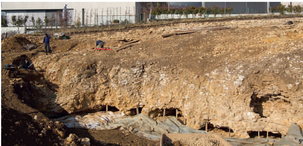
Fig. 5 Wangen bei Olten: la mine de silex pendant les fouilles de 2011. Wangen bei Olten: la miniera di selce durante lo scavo del 2011.

Comme, au Néolithique, on ne pratiquait pas encore d'agriculture intensive, on ne disposait pas de surplus alimentaire. L'activité minière, qui ne rapportait pas de pain, ne pouvait donc pas durer très longtemps. Il est ainsi probable que la mine n'a fonctionné que quelques mois par an, vraisemblablement à l'automne, après les récoltes. On peut envisager que, chaque année, un petit groupe de mineurs a creusé un puits dans la roche pour atteindre le niveau riche en silex et l'exploiter. Plusieurs groupes ont-ils travaillé en parallèle? Combien de puits au total ont-ils exploité? Ces questions restent pour l'heure ouvertes.