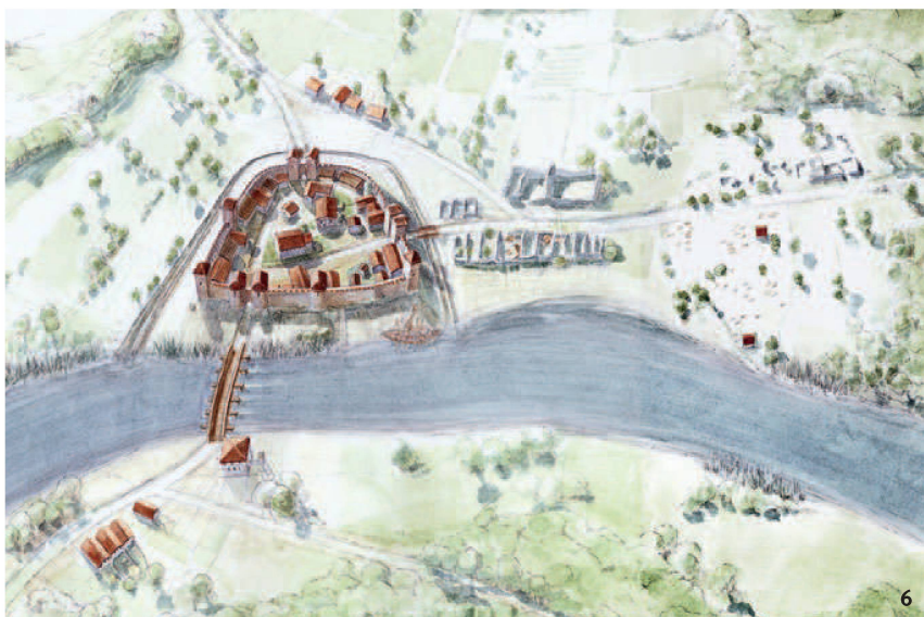
Fig. 6 Le castrum de Soleure vers 400. Il castrum di Soletta verso il 400.