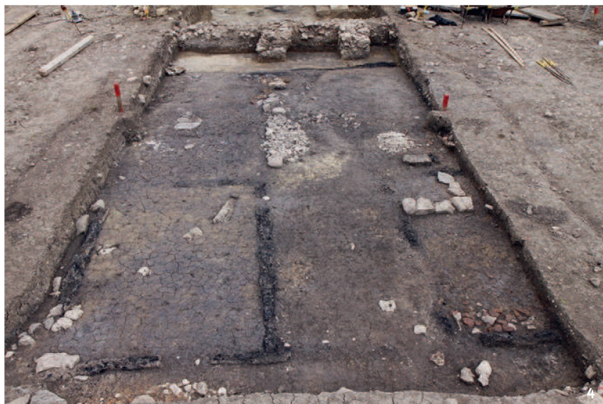
Fig. 4 Vestiges d'une maison d'Altreu. Au premier plan, on distingue deux pièces, dont celle de droite était dotée d'un poêle. Entre les deux, un corridor menait de l'entrée côté rue vers la cuisine, au centre de la maison.

In primo piano il terzo della casa rivolto sul vicolo con ripostiglio (a sinistra) e soggiorno con le fondamenta della stufa (a destra). Nel mezzo, un corridoio conduceva alla cucina situata nella parte centrale.