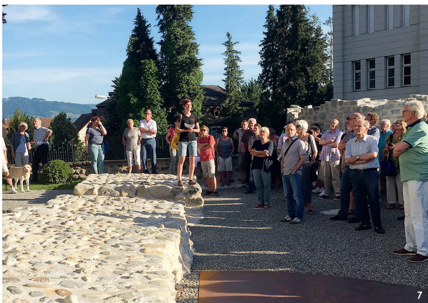
Abb. 7 Führung durch das Schlossareal von Arbon, dessen bewegte Geschichte mit erhaltenen Bauteilen und dem archäologisch-historischen Rundgang nachgezeichnet werden kann.

Visite guidée au château d'Arbon, dont l'histoire mouvementée est racontée à travers les éléments architecturaux conservés tout au long d'un parcours associant histoire et archéologie.