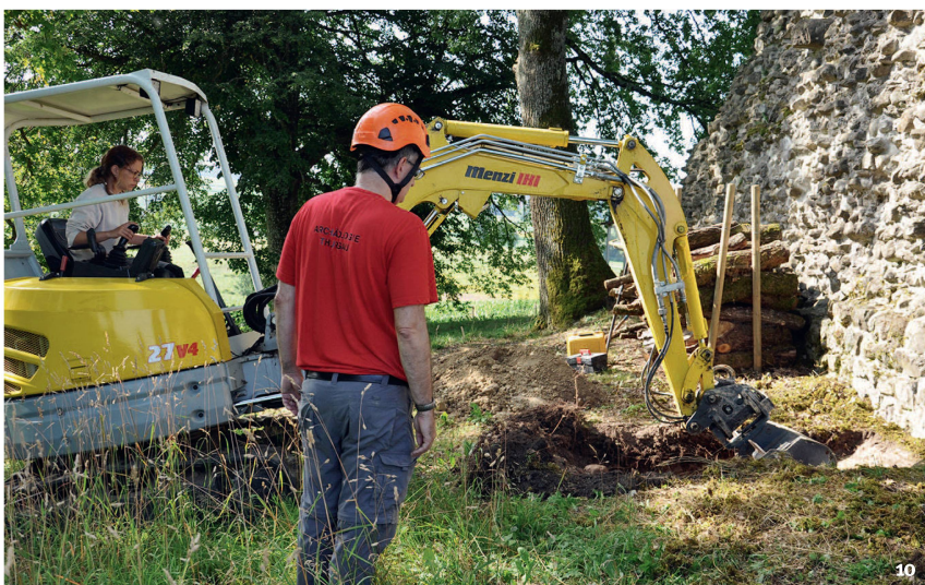
Abb. 10 Ruine Helfenberg in Hüttwilen. Sondierarbeiten im Sommer 2019. Ruine de Helfenberg à Hüttwilen. Travaux de sondages en été 2019. Rovine di Helfenberg a Hüttwilen. Sondaggi nell'estate 2019.

Des études du bâti recourant à des méthodes archéologiques ont été effectuées dès le 19 e siècle en Thurgovie, mais cette pratique n'allait s'établir que peu à peu, atteignant son apogée avec l'étude du site de Diessenhofen-Unterhof. Pour de nombreux châteaux, on dispose cependant aujourd'hui d'une abondance de nouvelles connaissances, publiées dans des rapports préliminaires.