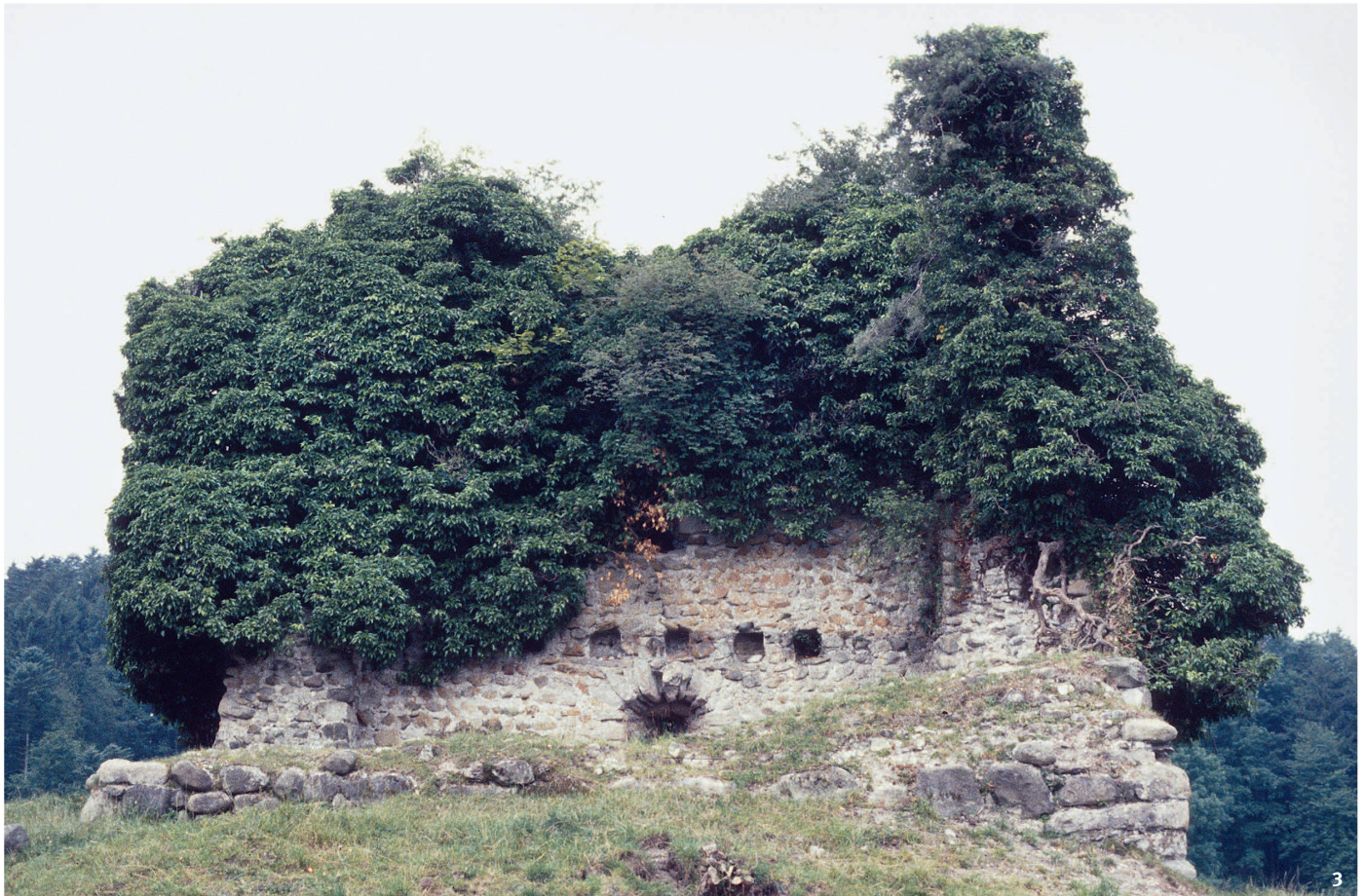
Abb. 3 Ruine Anwil mit Efeubewuchs vor der ersten Sanierung 1982.

Les ruines d'Anwil sous leur manteau de lierre avant les premiers travaux de rénovation en 1982.