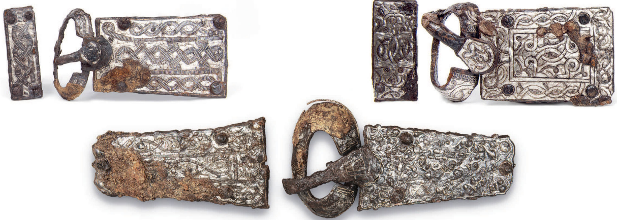
Fig. 6 Trois garnitures de ceinture en fer damasquiné découvertes à Gruvatiez (T87, T23, T89).

Drei Gürtelbeschläge aus damasziertem Eisen aus Gruvatiez (T87, T23, T89).