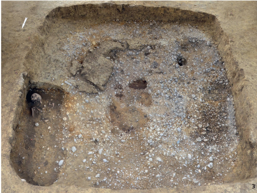
Fig. 3 La cabane ST126 en fin de fouille. Dans l'angle inférieur gauche apparaît la sépulture T99; la sépulture T101 était placée contre la paroi sud.

Das Grubenhaus ST126 am Ende der Ausgrabung. In der unteren linken Ecke ist das Grab T99 zu sehen; Grab T101 war an der Südwand platziert.