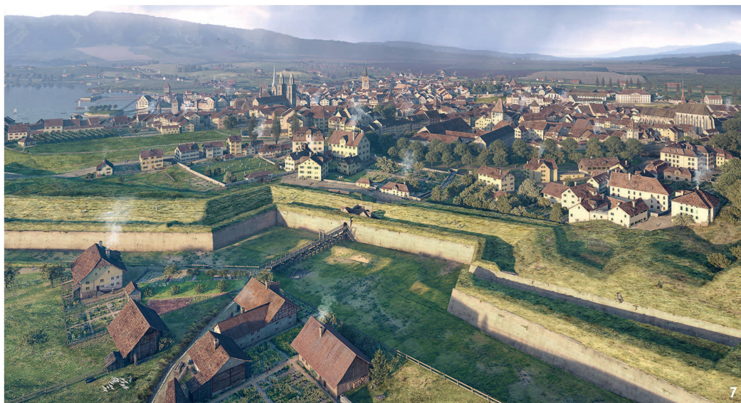
Abb. 7 Lebensbild von Zürich um 1800 mit dem Hottingerpörtl im Vordergrund. Restitution de Zurich vers 1800 avec, au premier plan, la Hottingerpörtl. Scena di vita di Zurigo verso il 1800 con Hottingerpörtl in primo piano.

Der Wolfbach wurde in einem hölzernen Kanal über den Graben, durch die Mauer und dann unter den Wällen in einem gemauerten Kanal geführt. Er trat erst hinter dem Hauptwall wieder an die Oberfläche. Auf Drängen der Hottinger Bevölkerung wurde wenige Jahre nach der Fertigstellung der Kurtine ein Fussgängerdurchgang eingebaut, das sog. Hottingerpörtl samt Holzsteg über den Graben. Archäologisch liess sich davon nichts fassen, von seinem Aussehen sind wir jedoch durch historische Ansichten und Pläne gut unterrichtet. Aus den 1780er Jahren sind mehrere Ausführungspläne von neu zu errichtenden militärischen