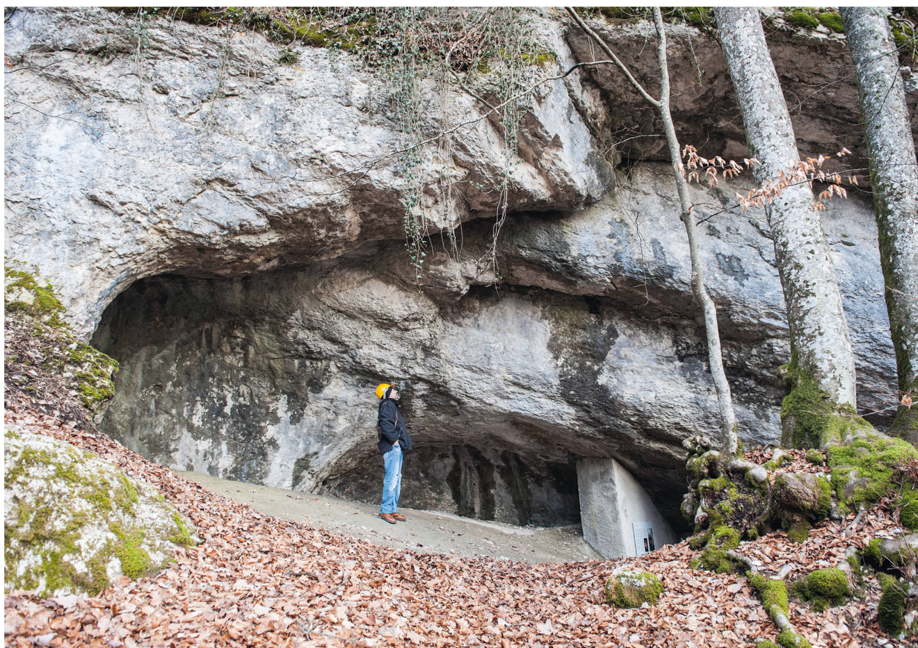
1 Vue de l'entrée de la grotte de Cotencher (Rochefort, NE).

Par Mathieu Luret, Jean-Christophe Castel et François-Xavier Chauvière