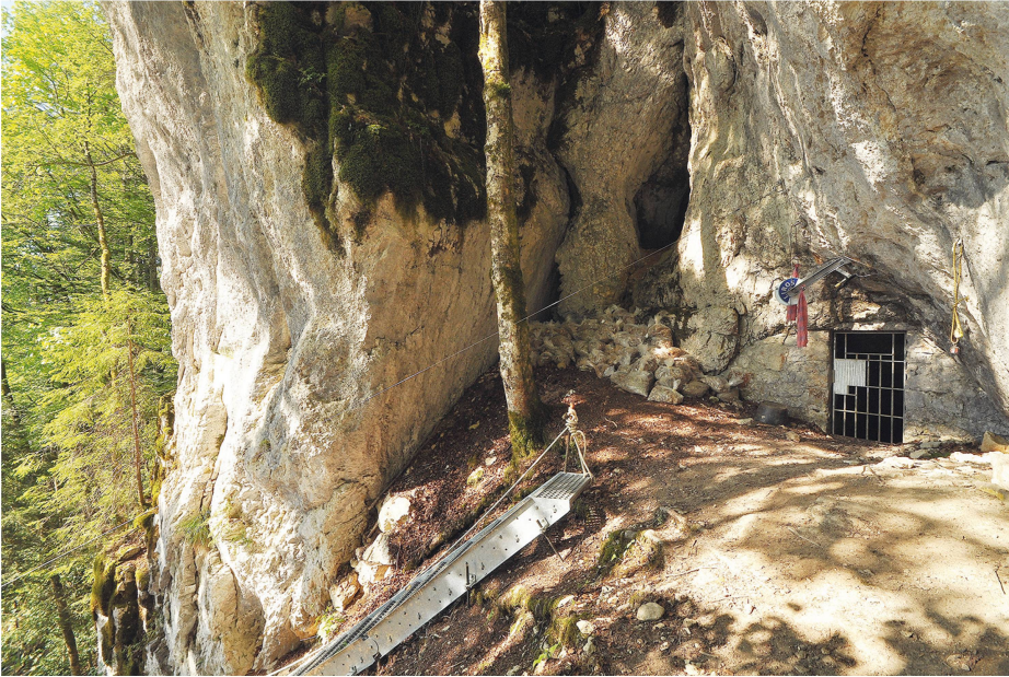
7 Grotte des Plaints (Couvet, NE). Vue de l'entrée de la grotte et des aménagements utilisés lors de la fouille archéologique.

Höhle von Plaints (Couvet, NE). Blick auf den Höhleneingang und die bei der Ausgrabung verwendete Infrastruktur.