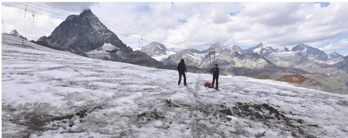
3 Documentation et prélèvement des restes d'un mulet sur le glacier du Théodule supérieur. À l'arrière-plan à gauche, le Cervin.

Dokumentation und Bergung der Überreste eines Maultiers auf dem Oberen Theodulgletscher. Links im Hintergrund das Matterhorn.