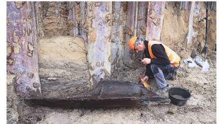
8 Der Einbaum von Sugiez bei seiner Freilegung.