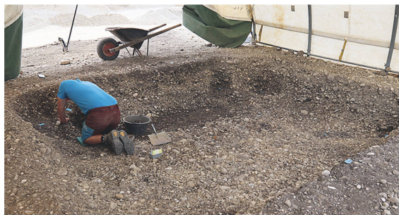
6 Frühmittelalterliches Grubenhaus in Marthalen-Nidermartel.