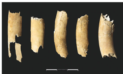
5 Die fünf Fragmente des Mammutstosszahns aus Wynau.