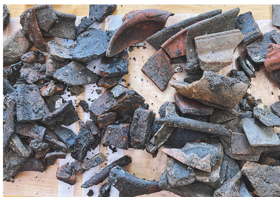
7 Kempraten-Belsito, bodenfrische Funde (Keramikscherben, kalzinierte Knochen) aus der fundführenden Schicht aus dem Bereich des Brandgräberfeldes.

Der Leitungsgraben griff im «Belsito» – knapp 60 m von der Fundstelle des Grabes entfernt – erneut bis in römische Schichten ein. Die bis zu 40 cm mächtigen Schichten zeichnen sich durch kalzinierte Knochen sowie durch eine überdurchschnittliche Funddichte besonders an Gefässkeramik aus. Dabei sind offene Formen wie Teller, Schalen und Schüsseln besonders häufig vertreten. Die Fundzusammensetzung und sekundären Brandspuren weisen die Schichten ins Umfeld des Brandgräberfeldes resp. eines Verbrennungsplatzes. Es dürften sich daher noch weitere Gräber im Boden verbergen.