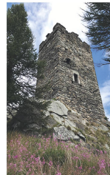
4 West- und Südfassade mit Hocheingang und Aborterker.