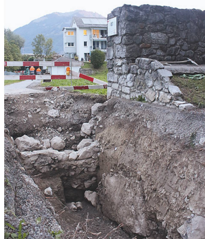
1 Blick auf den freigelegten (l.) sowie einen rekonstruierten (r.) Abschnitt der Letzimauer.

Leandra Reitmaier, AGL/Larissa König und Valentin Homberger, ProSpect GmbH