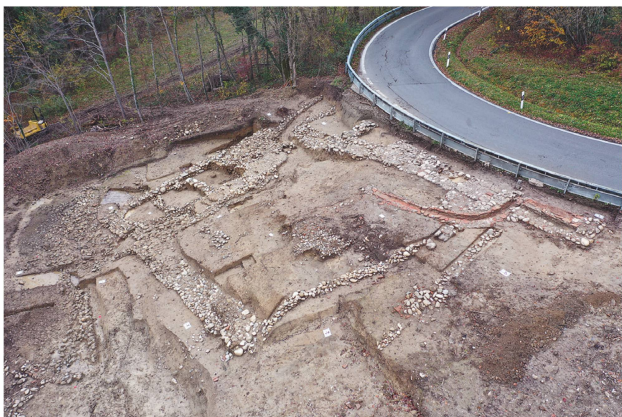
3 Villa romaine de Chancy – Montagny. Vue aérienne du site vers le nord avec, en haut de pente, l'actuelle route de Valleiry.

En 2022, une renaturation programmée dans la forêt de Chancy, en partie sur l'emprise d'une villa romaine, a permis au Service d'archéologie du canton de Genève d'évaluer l'état de conservation des vestiges situés à la limite occidentale du domaine. Enfoui sous la forêt depuis près de 100 ans, le site n'était connu que par un plan schématique en noir et blanc réalisé par Louis Blondel en 1929. Ce plan faisait état d'une imposante villa construite au 1 er siècle apr. J.-C., dont les ruines étaient partiellement recouvertes par les murs et les tours d'un castrum édifié à partir des 3 e -4 e siècles apr. J.-C. L'emplacement choisi était idéal pour surveiller les environs de ce lieu hautement stratégique: perché sur un promontoire, en bordure d'un ravin, il surplombait le Rhône et la voie qui permettait de rejoindre Lyon et Vienne depuis Genève. Chancy était en outre un lieu de passage prisé, puisqu'à cet endroit le fleuve pouvait être traversé à gué.