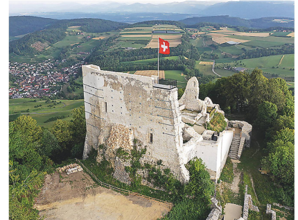
2 Die Burgruine Farnsburg, wie sie sich aktuell präsentiert.