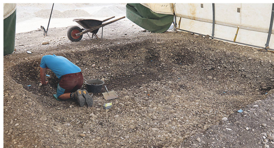
6 Frühmittelalterliches Grubenhaus in Marthalen-Nidermartel.