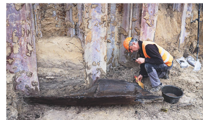
8 Der Einbaum von Sugiez bei seiner Freilegung.