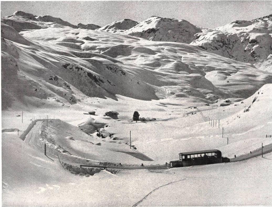
Phot. A. Steiner, St. Moritz Julierstrasse im Winter offen. - Partie oberhalb Bivio.