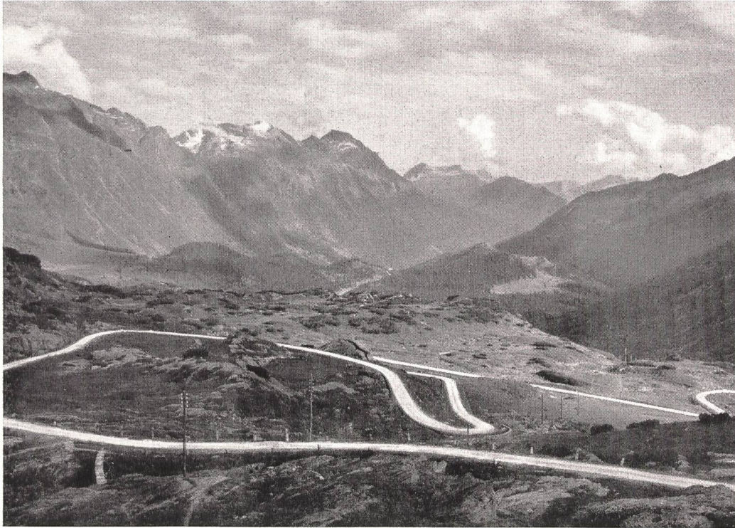
Blick von der S. Bernhardin-Passhöhe gegen Misoxertal.