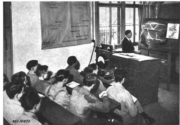
Fig. 1. Theoriestunde

ärgert, benützten die Handwerker oft nur noch zur Not die Elektroschweissapparate. Ein gewisses Misstrauen gegen dieses Schweissverfahren wollte Platz greifen. Diese Erscheinung war dem Umstand zuzuschreiben, dass der Maschinenverkäufer dem Benutzer in einem kurzen Vorführungsschweissen den Apparat wohl erklärt und vordemonstriert hatte, dann aber blieb der Käufer sich selbst überlassen. Je nach Können oder Selbststudium konnte er nun den teuer gekauften Apparat mehr oder weniger gut anwenden. Schweissen muss man lernen und lehren, und zwar nicht vom Nebenmann, der oft auch keine methodische Anleitung erfahren hat.