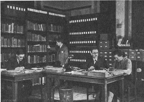
Fig. 1 Eine Ecke im Informationsbüro der ERA mit der umfangreichen Kartothek

Fig. 1 zeigt einen Ausschnitt aus dem Informationsbureau mit dem wissenschaftlichen und technischen Index, der allen Mitgliedern selbst über das Telephon zur Verfügung steht und über 35 000 verschiedene Artikel und Sachgebiete enthält.