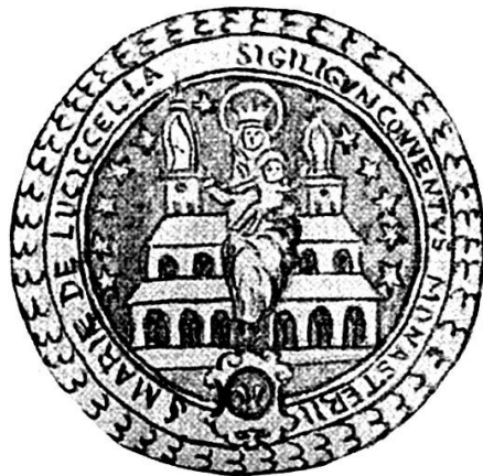
Sceau de l'Abbaye de Lucelle.

Telles étaient les restaurations du monastère, après la destruction de Lucelle, à la Réforme, en 1525, quand éclata la