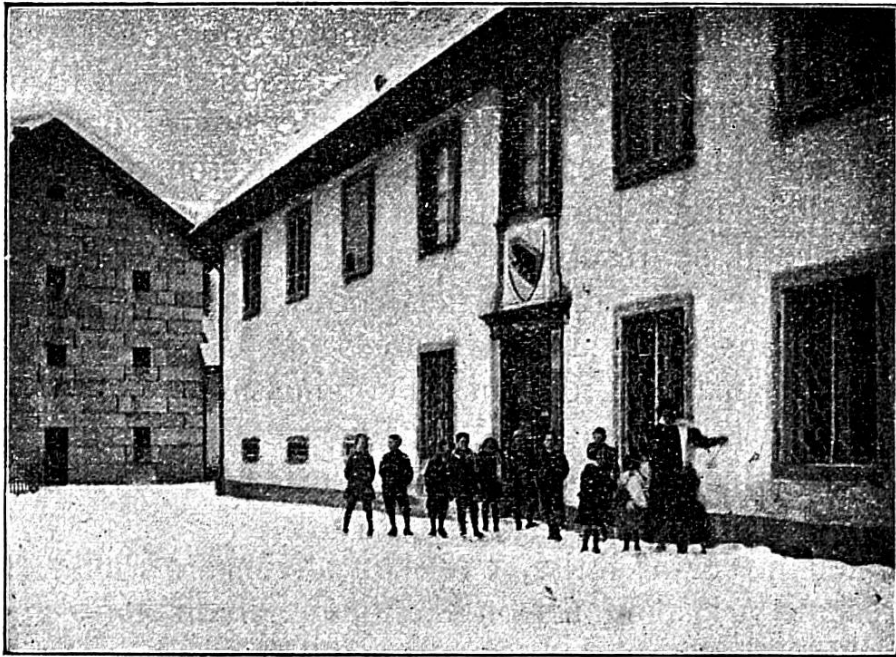
Cour de la Préfecture de Courtelary