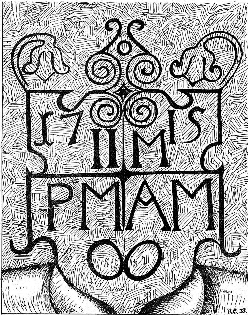
Fig. 3. — Ecusson armorié, de 1715, au linteau d'une porte de grange