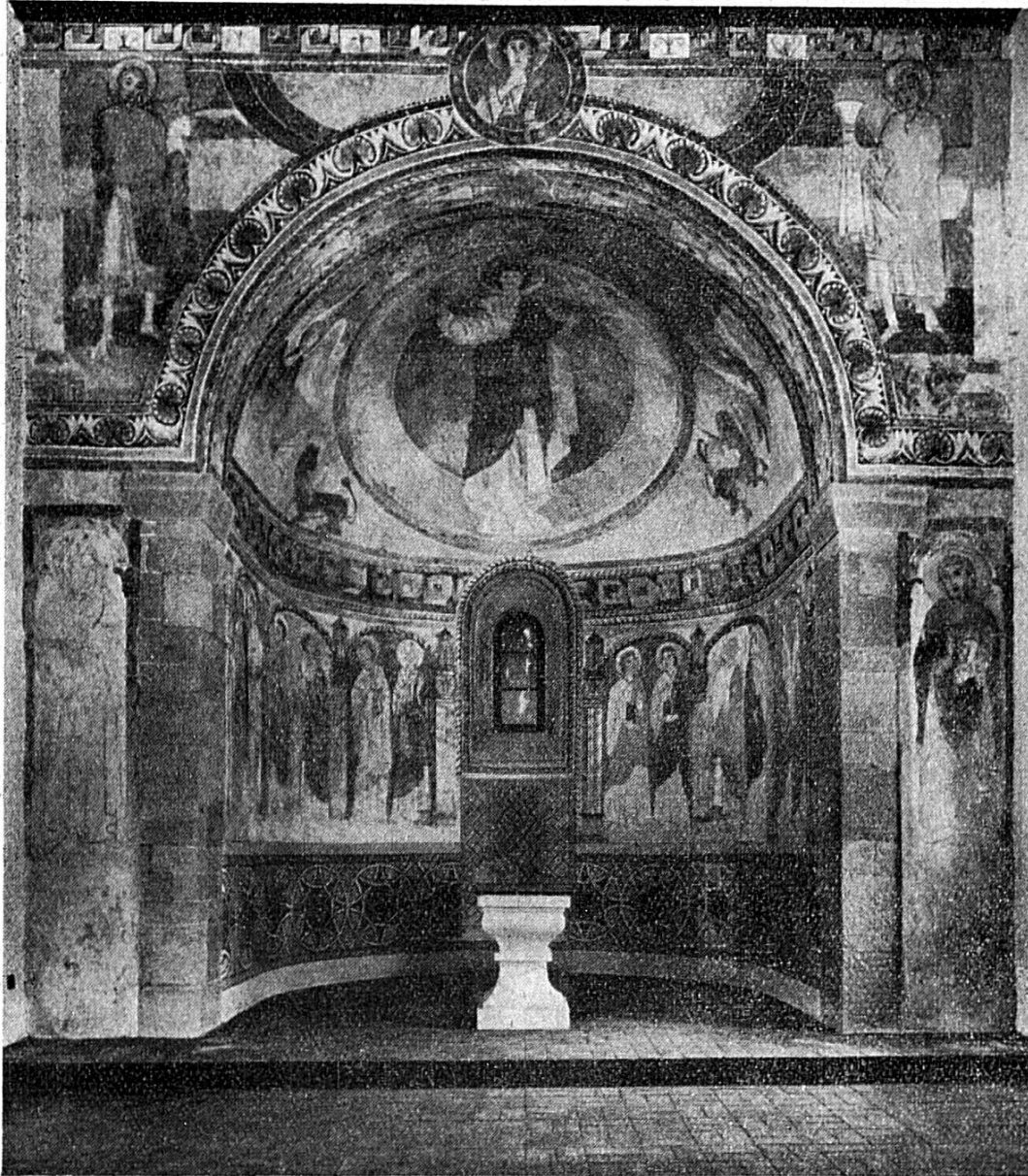
Le Chœur de l'Église de Chalières

à tort on a transformé en ange) parce que St-Matthieu commence son récit par la généalogie du Christ dans l'ordre humain. Le deuxième Evangile est représenté par le lion , le roi du désert : parce que St-Marc ouvre l'Evangile sur le tableau de St-Jean