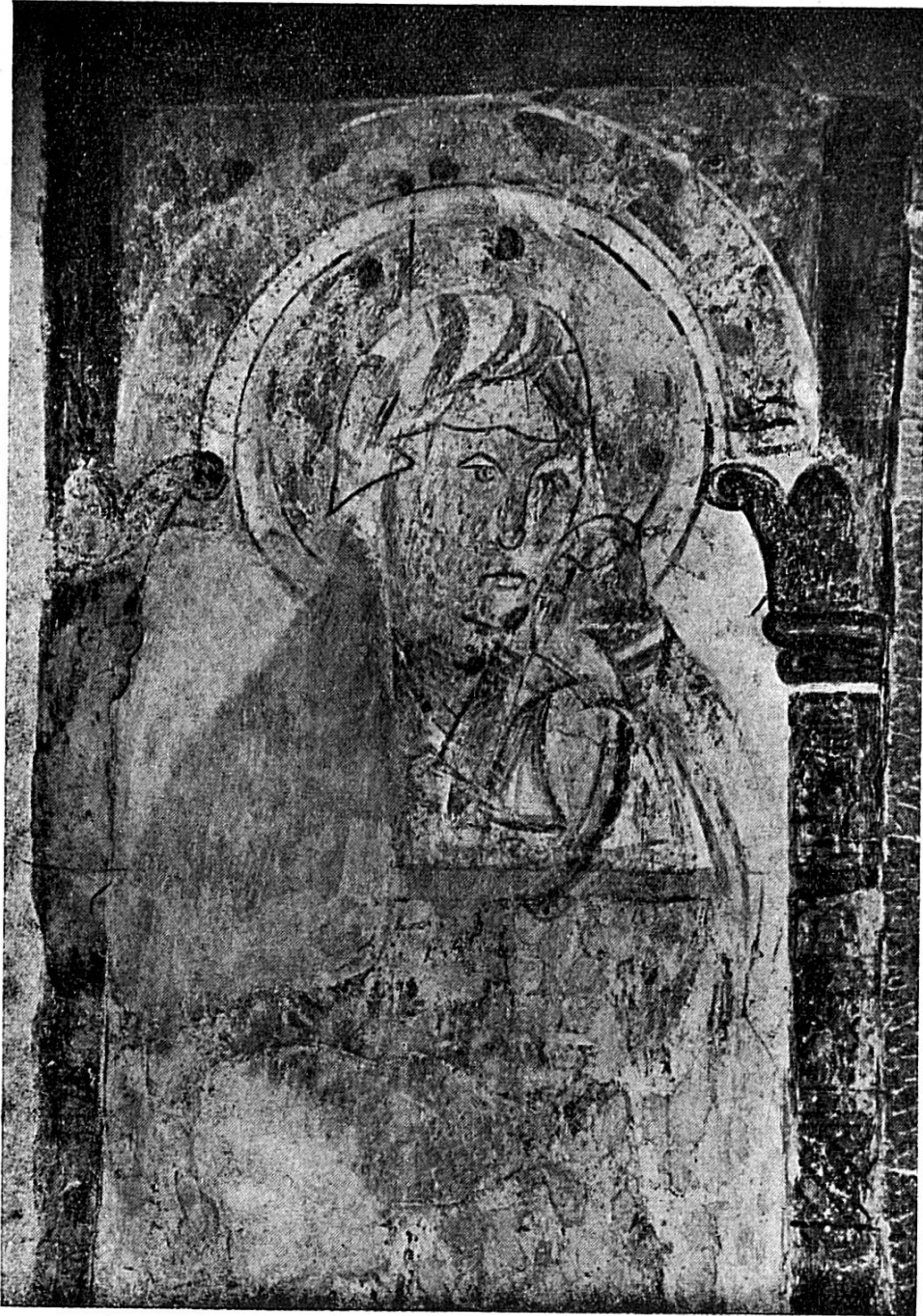
La Vierge de Chalières