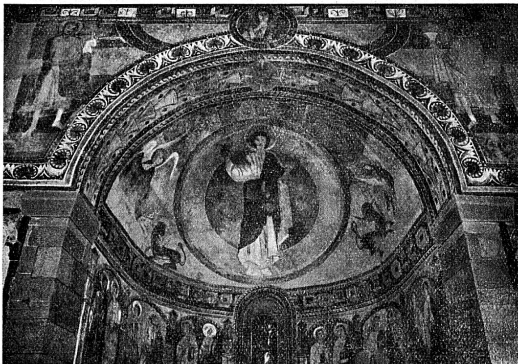
La Voûte de l'Église de Chalières

» Le Christ enseignant : vous le voyez représenté par la grande figure centrale de l'abside : ses pieds reposent sur le globe terrestre et sa tête nimbée de gloire semble pénétrer les