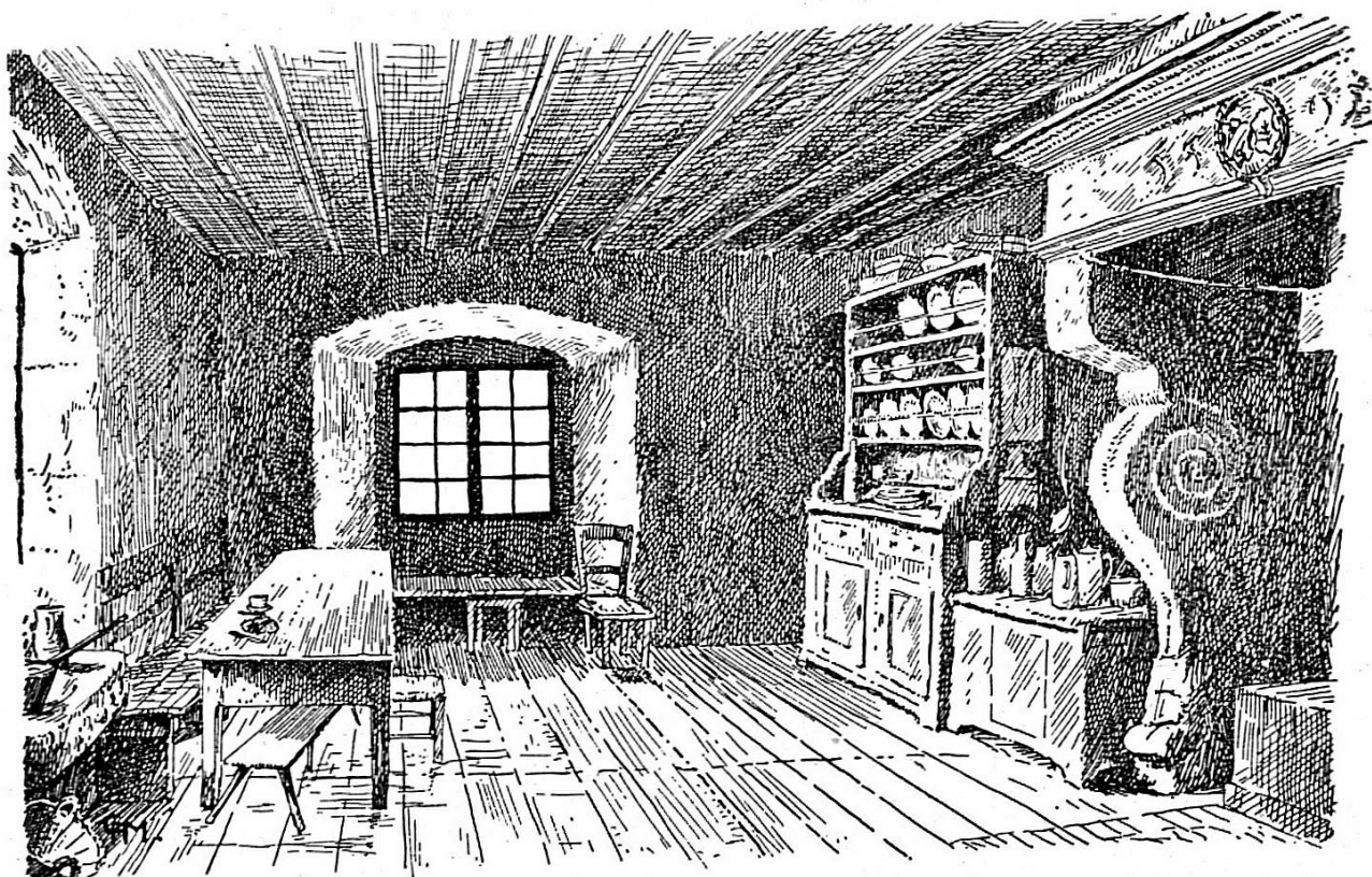
Château de Raymontpierre. Salle des chevaliers

Et comme un bonheur n'arrive jamais seul, Georges Hugué, à l'époque où il devenait possesseur du Raimeux, était élevé dans la noblesse impériale par l'empereur Rodolphe II. Selon une « lettre de noblesse » conservée en copie aux archives de Berne, il obtenait pour lui et ses descendants, en ligne mâle, l'insigne honneur de s'appeler « de Remontstein ou de Raymontpierre ». Ses armes étaient « d'or à la bande d'azur accompagnée de 2 feuilles de trèfle de sinople, l'une en chef, l'autre renversée en pointe ; l'écu timbré d'un heaume de chevalier et surmonté de 2 cornes de buffle d'or à la bande d'azur, scellé de 6 feuilles de trèfle de sinople ».