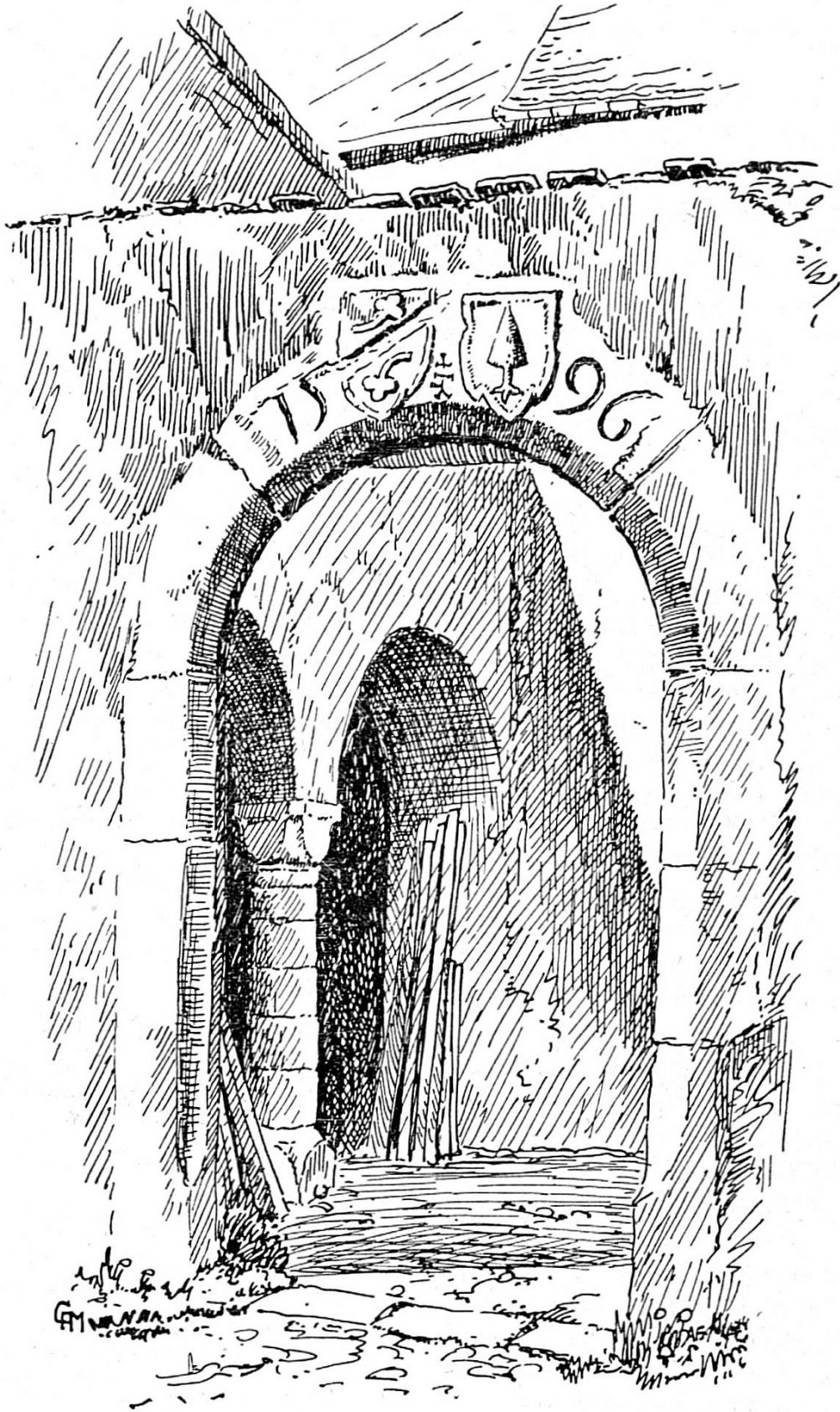
Château de Raymontpierre. Porte d'entrée