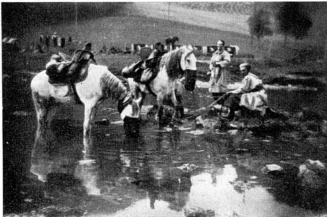
Soubey et son Doubs transformés en oued

Le capitaine, nerveux, fait faire le bivouac, demande à pouvoir acheter un peu d'avoine, à n'importe quel prix. Depuis 48 heures ils n'en ont plus. Encore une vision dans le film de ces jours : ces hommes basanés, accroupis à la musulmane sur les pierres du Doubs, faisant boire leurs montures piaffantes, des gestes lents, une langue gutturale ; Soubey et son Doubs transformés en oued, en oasis du Sahara !