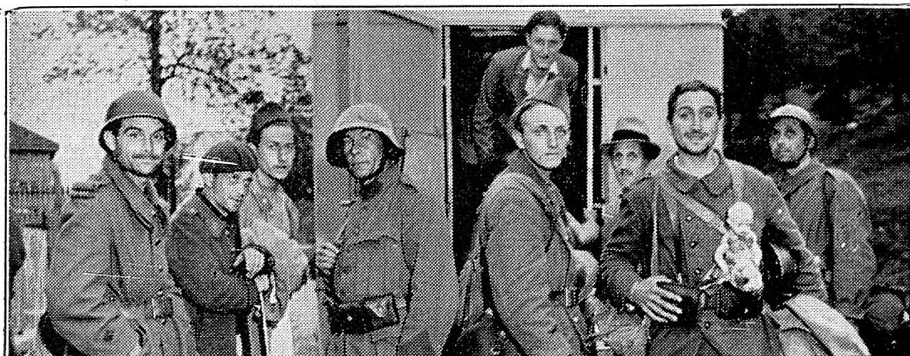
Les premiers soldats français arrivent à la frontière suisse

Le dimanche 16 juin, vers 6 h. du matin, les premiers réfugiés civils français entrent à Boncourt. Ce sont des habitants de Delle et des villages voisins. Le défilé continue toute la journée et toute la nuit. Les premiers douaniers français arrivent dans la soirée. Beaucoup d'automobiles : on organise des parcs.