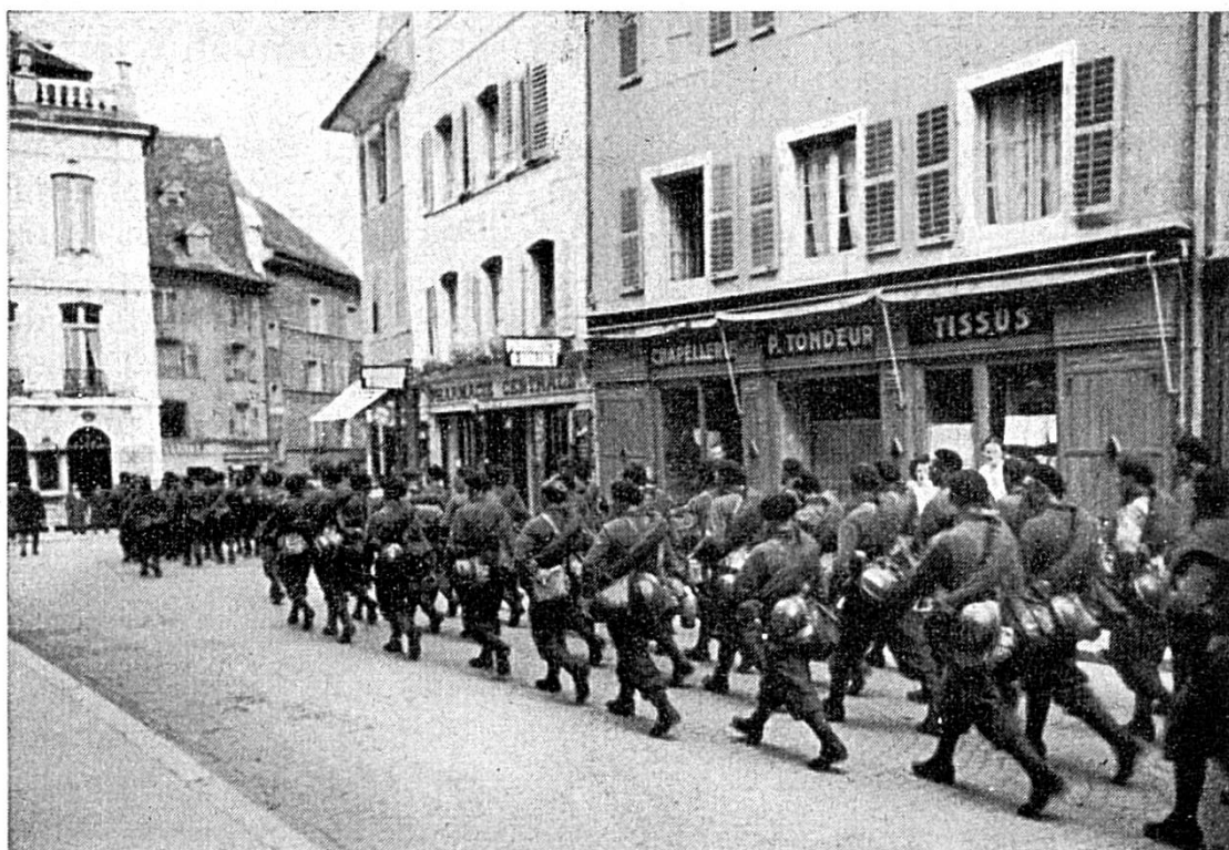
Soldats polonais à Porrentruy, Rue Centrale

Des camions ne vont pas tarder à emporter les réfugiés. Le temps presse : il s'agit de les envoyer au plus tôt à l'intérieur ; des soldats français, polonais, belges, sont signalés à la frontière. Ils déposeront les armes et seront internés en Suisse. Durant trois jours et trois nuits, ce n'est que le défilé bruyant de centaines de véhicules motorisés soit suisses, soit étrangers, sur toutes les routes du pays.