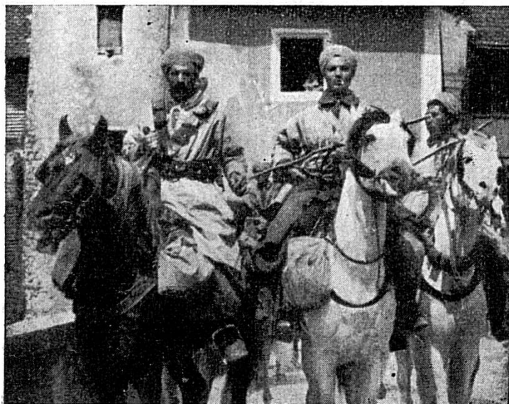
A St-Ursanne, un groupe de spahis

Les troupes automobiles furent acheminées sur Delémont par Develier. Les troupes hippomobiles et à pied le furent sur Boécourt. Ces évacuations se firent en bon ordre. Cependant, que de difficultés dans la montée