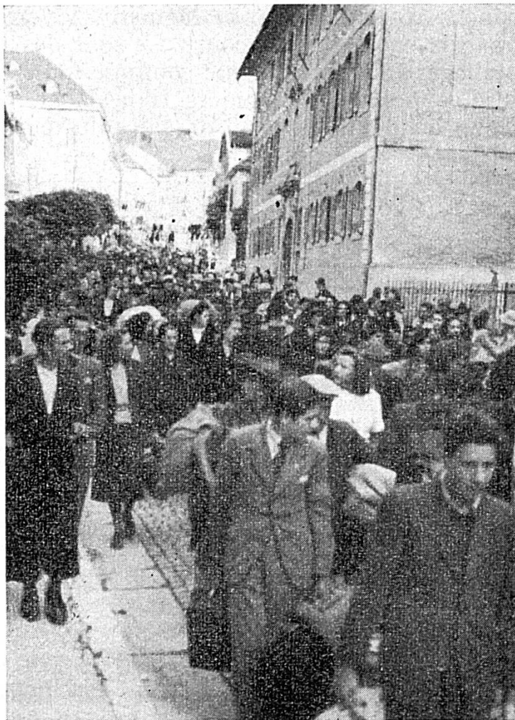
Réfugiés civils à Porrentruy, Rue de la Préfecture

Dans la soirée du même jour, 3 à 400 soldats polonais qui n'ont pas pu trouver de place à Porrentruy, arrivent à Fontenais