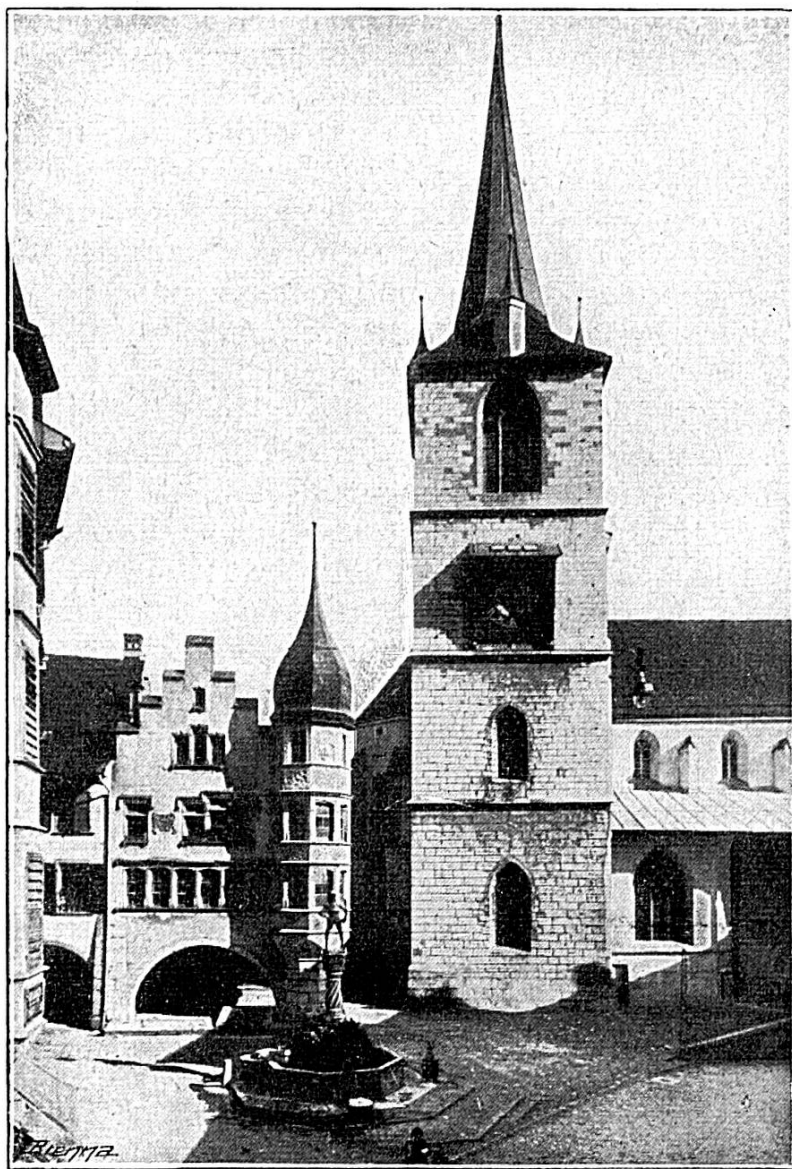
Eglise Saint-Benoît et le Ring

partie octogonale, fut achevé sur contrat de 26 couronnes et 2 Dicken, par Michel Woumard. On l'a modernisé en 1835. Le même Michel Woumard composa la statue 1 ; et nos archives nomment le prix de 63 livres qui fut payé pour la barre de fer qui l'étoyait sur son socle.