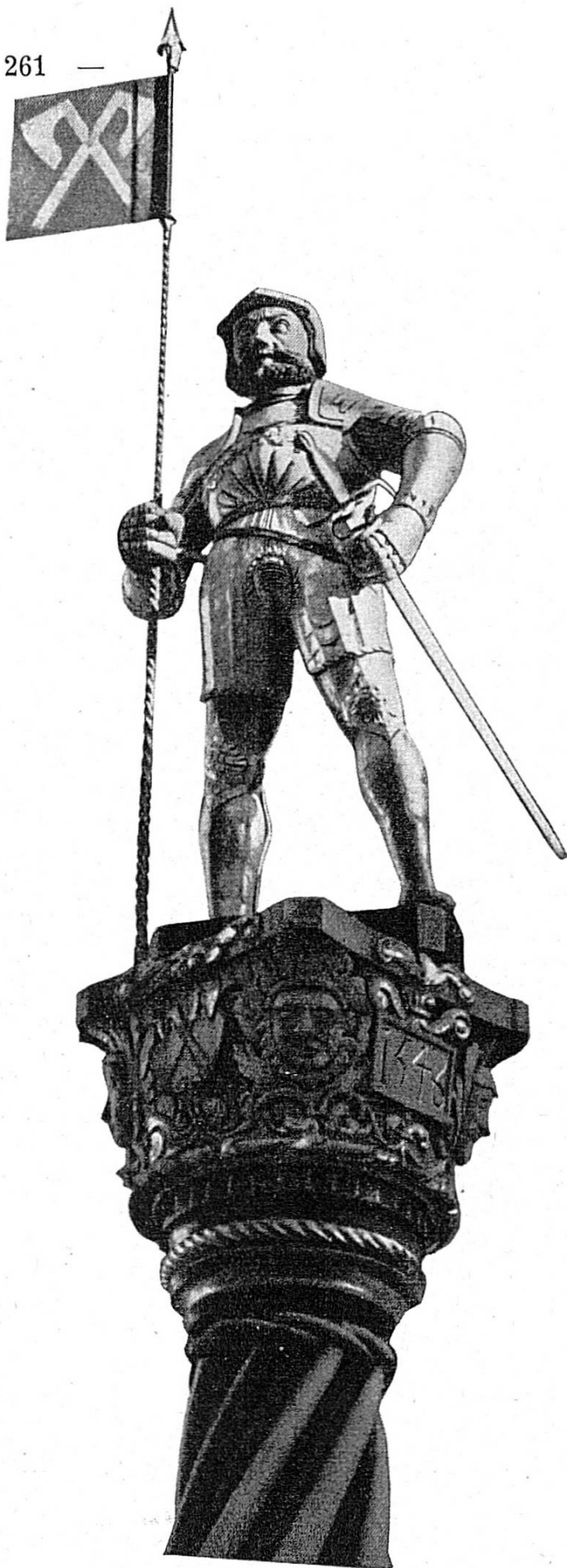
Fontaine du Banneret

Rude mais affirmatif, l'ouvrage rappelle qu'il y avait plus de deux siècles, quand il fut érigé, que les milices des Petits Cantons avaient affronté l'ennemi à Morgarten. Depuis lors, les contingents de Bienne avaient combattu dans les rangs de l'armée fédérale à Grandson, à Morat et jusqu'à Nancy; puis, appelés par Berne, ils s'étaient aventurés dans