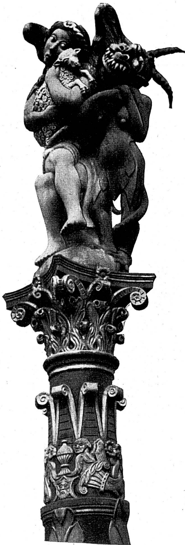
Fontaine de l'Ange

C'est à courte distance de l'Auberge de la Couronne, près d'une rangée de maisons bourgeoises