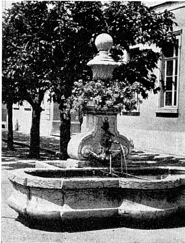
Nidau: Fontaine de la cour du collège

Inversement, on reconnaît un exemple simple et assez pur du style baroque en la fontaine de la cour du Collège, de construction plus ancienne. Des arêtes séparent les parties droites et cintrées de son double bassin qu'un dessin mouvementé fait alterner. Etayé sur chaque flanc d'un profil de volutes, le socle épais et court s'évase au-dessus. Un véritable buisson de verdure et de fleurs enveloppe les moulures complexes du chapiteau et la