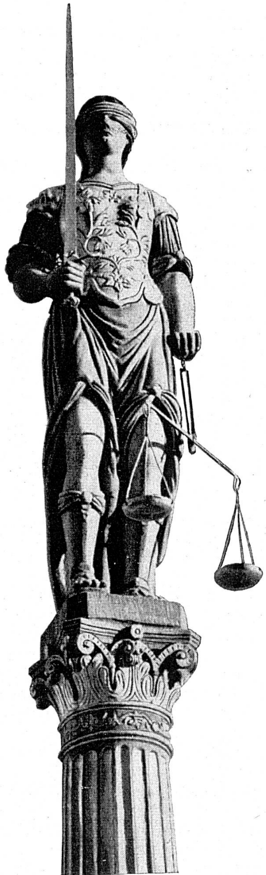
Fontaine de la Justice

L'émigrant français Jean Boyer en tailla la statue en 1714, sur un modèle vétuste de l'année 1535. La figure même de la Justice, traditionnelle allégorie des devoirs