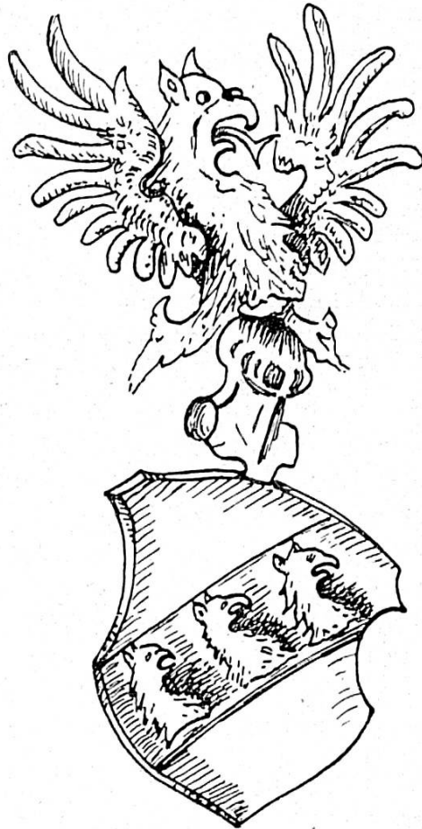
Fig. 3. Blason portant des griffons, attribué par erreur aux nobles de Porrentrut, d'après un ancien armorial de l'Evêché de Bâle

graphié: von Provoncourt 29 . Alors, il n'aura pas pensé à la petite localité de Bremoncourt et le nom, mal lu, fut interprété comme Porrentrut ou Prunentrut . Et si le peintre a représenté des griffons et non des dragons, c'est qu'il aura confondu ces deux animaux, car le cimier des Bremoncourt a des ailes d'oiseau et, logiquement... il fallait dessiner aussi un buste d'oiseau. Voilà ce qu'il arrive lorsque l'on veut corriger les anciens documents!