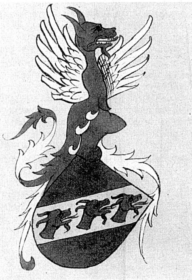
Fig. 2. Blason des nobles de Bremoncourt (1441), avec des dragons, d'après une copie du Livre des fiefs nobles de l'Evêché de Bâle.

Louis Vautrey, dans le deuxième volume de ses notices historiques sur le Jura bernois, écrivait en mentionnant les armoiries de la famille noble de Porrentruy: «Elle portait dans ses