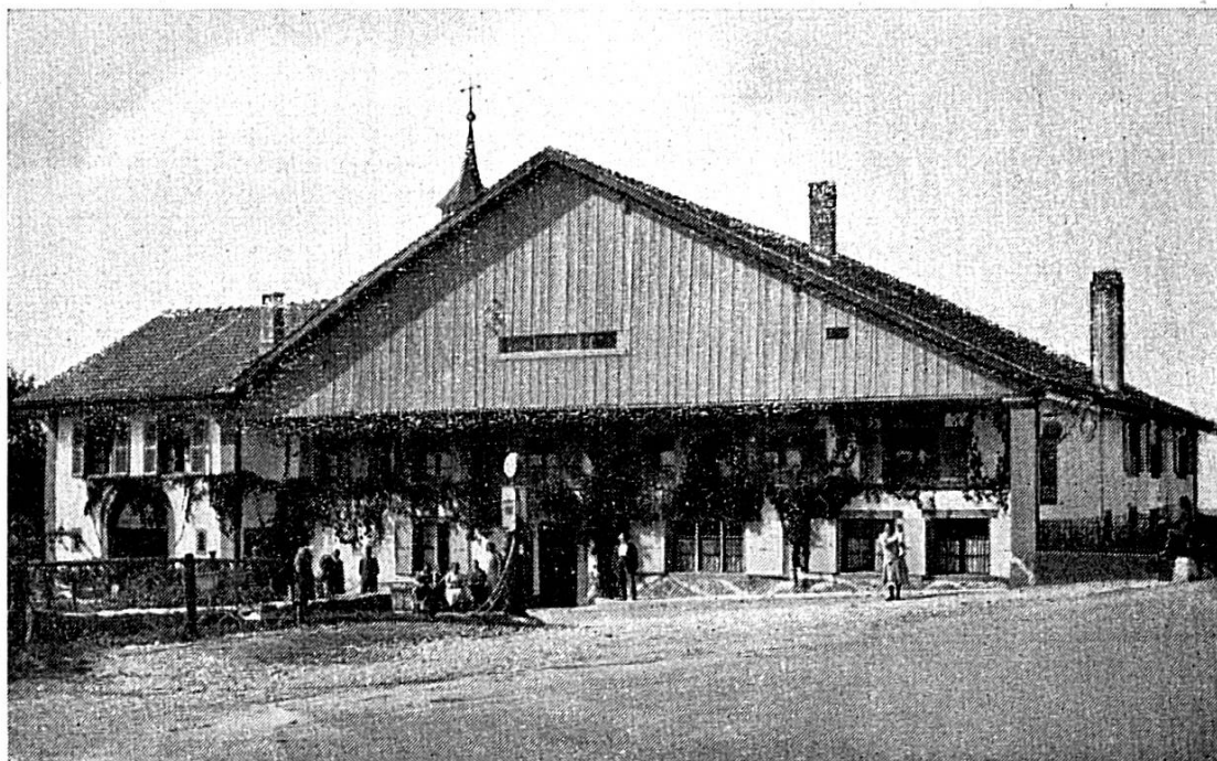
Façade de l'ancien « Logis de la Licorne » à La Ferrière

Les documents appellent l'unique auberge de La Ferrière d'autrefois le « logis » ou « l'enseigne » de la Licorne. Quelle signification cette enseigne avait-elle ? Elle était empruntée à la fois à la médecine et à l'hôtellerie, car le « maître de céans » était bel et bien chirurgien et hôte.