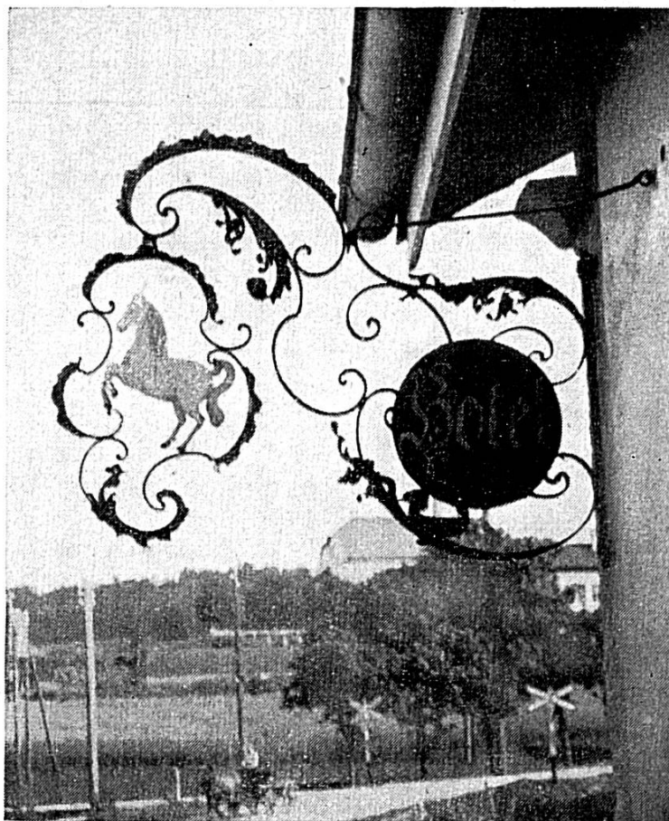
L'enseigne en fer forgé de l'ancienne Licorne, aujourd'hui le Cheval Blanc