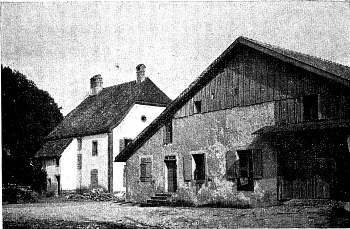
L'arrière de l'ancien « Logis de la Licorne » à La Ferrière