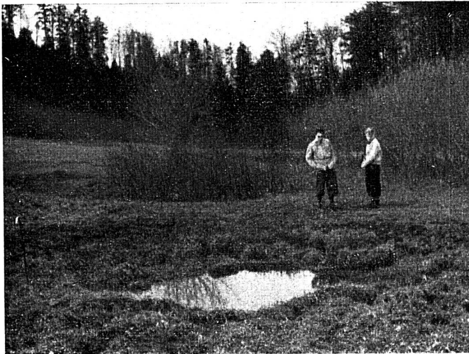
( Fig. 3 ). La petite cluse de Chésel, avec ses emposieux en activité. Leur fonction: minage de l'infrastructure.

La petite cluse de Chésel, cote 820, de la Montagne de Develier, ( fig. 3 ), percée au travers d'escarpements Rauraciens de peu d'importance, illustrera à nouveau le rôle des emposieux et celui du minage d'une croupe montagneuse. Un alignement