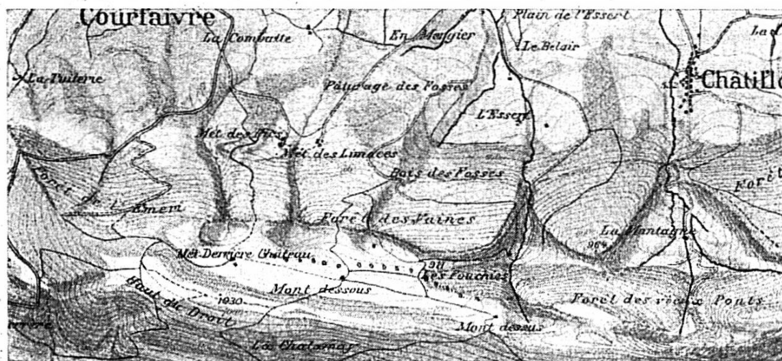
(Fig. 2). Un ensemble de quatre cluses, ou mieux de ruz fortement burinés sur les pentes N. de la Montagne de Vellerat. Alignement d'emposieux. Ceux de droite communiquent entre eux par un ruisseau souterrain. Ils finiront par prolonger le val venant de la cluse des Vaines, qu'ils ont contribué à creuser. Remarquer le « val de flanquement » de la cluse des Fouchies, et la cluse en \psi de Châtillon.