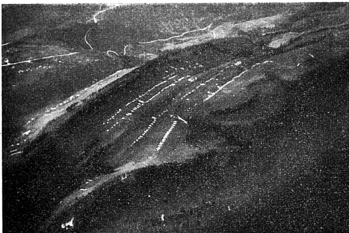
(Fig. 1). L'alignement d'emposieux d'Elay. (Seehof). Photographie prise par le Dr Péronne, à environ 3000 m. d'altitude. Une couche de neige tapisse le fond de ces emposieux. Leur forme allongée transversalement témoigne de leur formation, par l'eau dévalant les pentes. Autorisation de publier A C F 16809