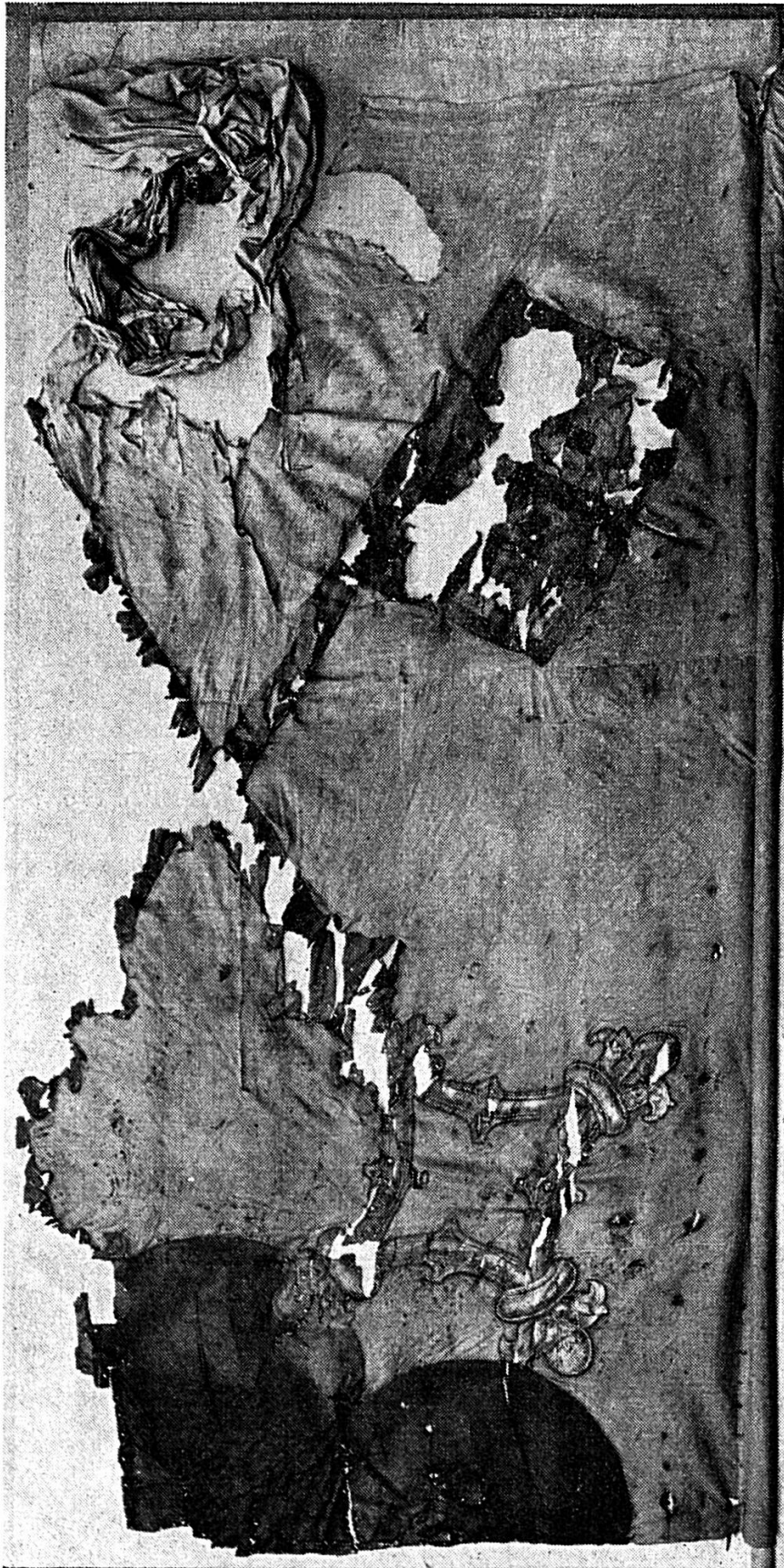
Bannière octroyée par Maximilien Ier le 2 mai 1497 (avant sa restauration)