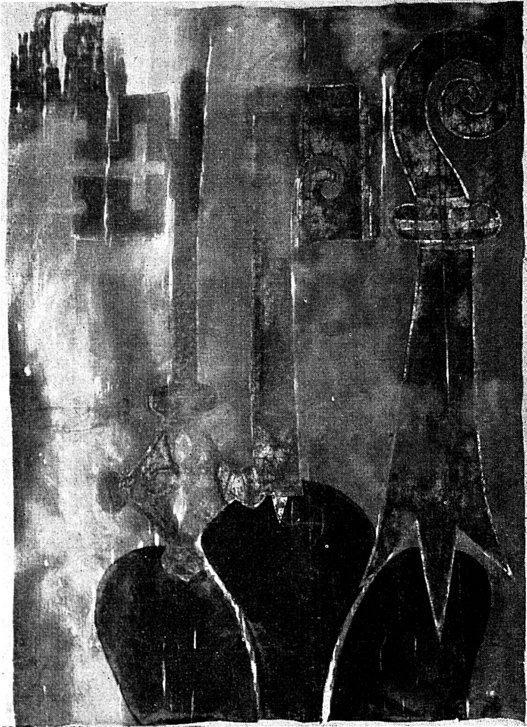
Bannière du traité de combourgeoisie avec Bienne du 14 septembre 1395 (après sa restauration de 1960)