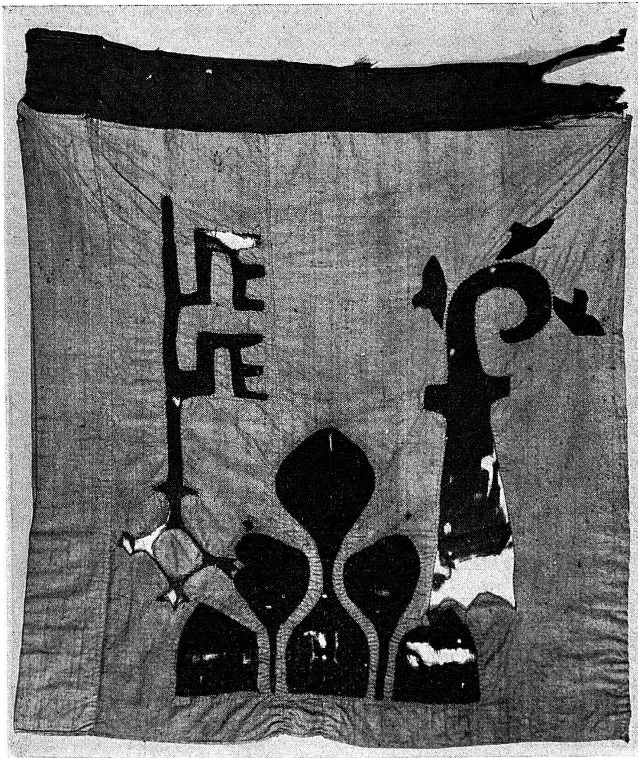
Bannière octroyée par Jean de Vienne le 19 juin 1368 (avant sa restauration)