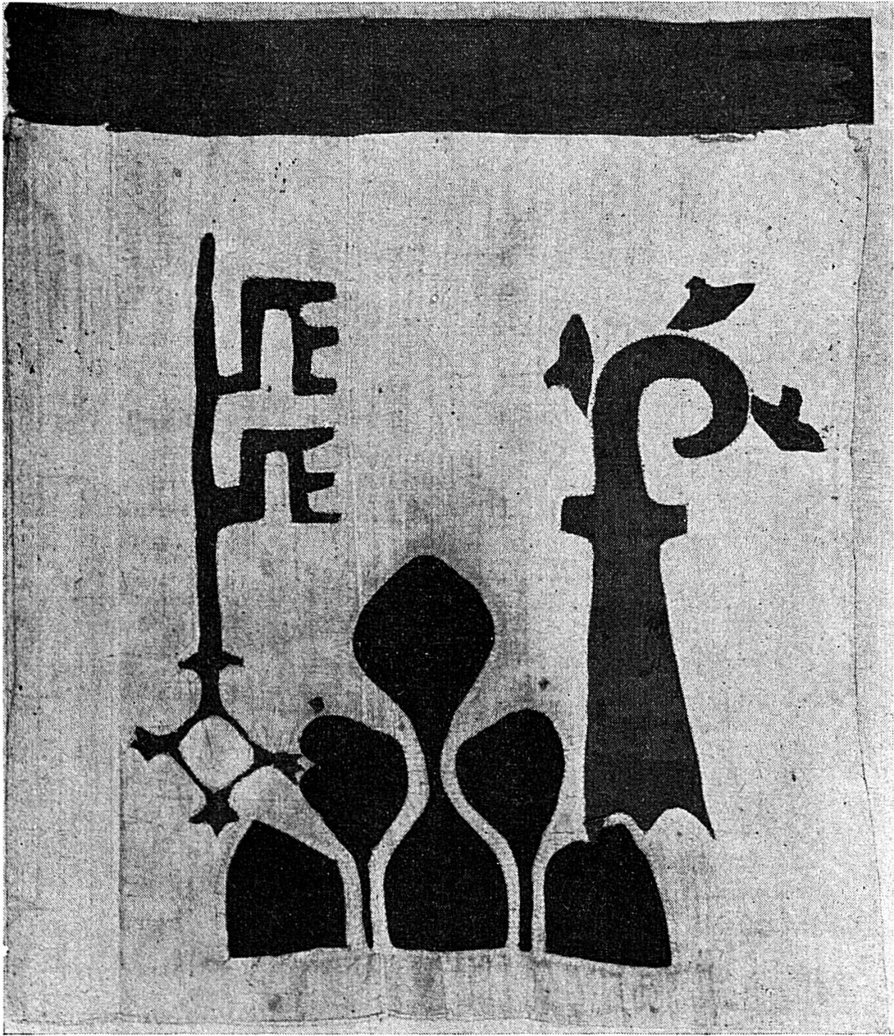
Bannière octroyée par Jean de Vienne le 19 juin 1368 (après sa restauration en 1960)